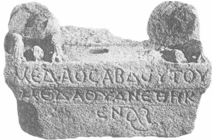
4 Een structuur uit het Syrische Suweidah