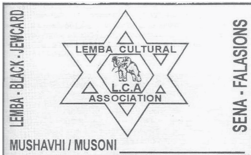
Het embleem van de Lemba Cultural Association.

De Lemba is een etnische groep van enkele stammen die leven in het hedendaags Zimbabwe en in de provincie Limpopo (voormalig Noord-Transvaal) in Zuid Afrika. Zij noe-