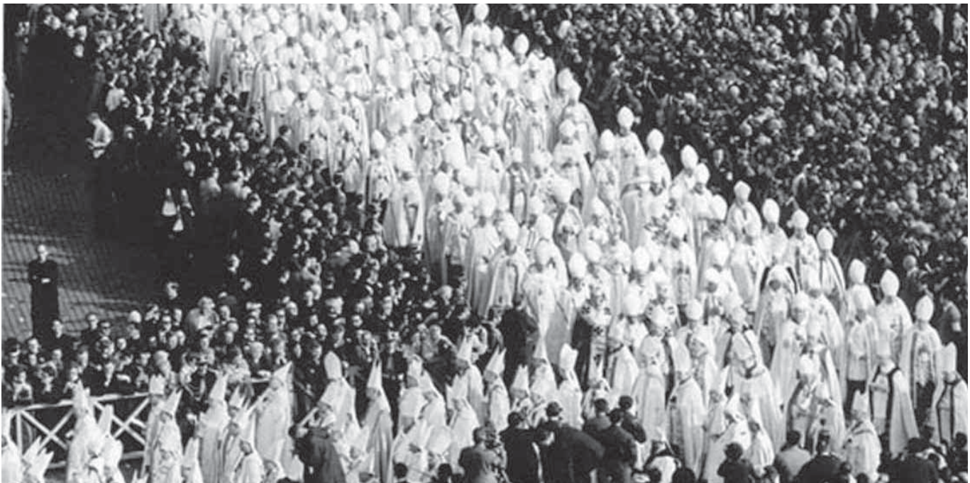
Stoet van bisschoppen bij de opening van het Tweede Vaticaans Concilie.

De verklaring maakt eens te meer duidelijk hoe diep de onzekerheid is onder Joden over de intenties van de Kerk. Dat is een reactie op de ambivalentie in recente kerkelijke documenten en verklaringen. Müller bepleit een adequate interpretatie van de kerkelijke leer, maar de onduidelijkheid op dit punt is precies de zorg van het ZdK. Diepste aanleiding was immers het problematische gebed voor de Goede Vrijdagliturgie in de Tridentijnse ritus. Men kan die onzekerheid niet afdoen, zoals bisschop Müller doet, door te stellen dat het aan de dialoogpartners is om te werken aan verzoening, of te onderstrepen dat de ZdK-verklaring geen kerkelijke autoriteit bezit. Dialoog is, voor Joden en ook voor een deel van de katholieken, onverenigbaar met zending.