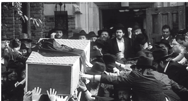
Volgelingen van Menachem Schneerson raken na diens overlijden de kist aan van de rabbijn die zij zien als de Messias die spoedig zal terugkeren.

Deze ontwikkelingen roepen natuurlijk reacties van seculiere of gematigd religieuze zijde op. Die zijn eveneens zichtbaar op de muren, zij het dat je goed moet zoeken. Bijgaande graffiti (zie foto Ussiskhin Street) vond ik op het grensgebied van een overwegend religieuze en een overwegend seculiere wijk. Het hoedje en de peies suggereren ultraorthodoxie. De tekst klinkt als een klaroenstoot: 'Niet bij ons!' Deze graffiti laat heel helder de afkeer zien van ultraorthodoxie. 'Niet bij ons' wil blijkbaar uitdrukken dat men ultraorthodoxe pressie niet accepteert. Of keert men zich tegen iedere vrome aanwezigheid? Dat zou dan het commentaar van de tweede hand verklaren, die in cursief Hebreeuws toevoegt: 'Waar dan wel?' Of vroeg de tekstschrijver zich af wat werd bedoeld met 'ons'? Inderdaad, de scheidslijn tussen orthodox en seculier is in West-Jeruzalem niet altijd scherp. Of bedoelt de commentator aan te geven dat er eigenlijk nergens religieuze pressie zou moeten zijn? De rode graffiti is een ludieke tekst: 'Eeuwige dienst van de aardbeien'. Waarschijnlijk houdt deze graffiti verband met de verkiezingen en spot het met de uitzichtloosheid van het