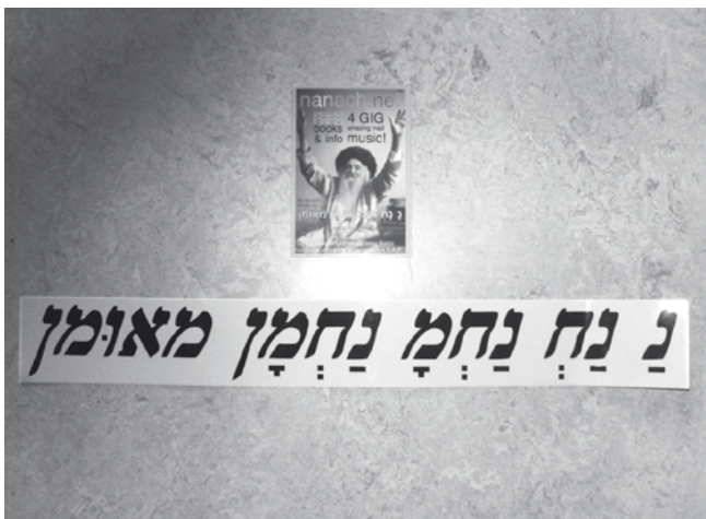
'Na, Nach, Nachman, Me-Uman'.