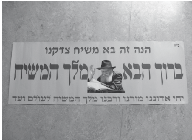
'Baroech Haba Melech Hamashiach', Welkom, Koning Messias! Met, veelzeggend, de foto van de rebbe.

Land zag als een gebod, maar niet kon instemmen met een Joodse staat zonder tussenkomst van de Messias.