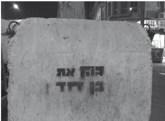
'Kohen samen met de Zoon van David', een wat ongebruikelijk Hebreeuws. Deze graffiti was op veel plaatsen zichtbaar in de zomer van 2010, vooral op betonnen paaltjes en verkeersblokken langs de wegen. Hier op Jaffa Street.

schap behelst van een mij nog onbekende groep (zie de foto in Jaffa Street). De combinatie van een Messias als zoon van David en een priester is frappant. David was geen priester dus deze Messias moet wel van zeer bijzondere aard zijn. Wie kan dit raadsel oplossen? Een groepering die de Tempelherbouw centraal stelt, of een Messias belijdende groep die in het kielzog van de brief aan de Hebreëen Jezus als zoon van David en als priesterlijke Christus aanprijst?