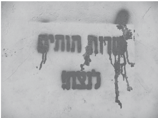
Uitvergroting van bovenste deel van vorige foto. 'Dienst aan de aardbeien voor eeuwig!'

Uman is de plaats waar Nachman is begraven en deze plek vormt in toenemende mate een populaire bedevaartsplaats voor ultraorthodoxe Joden. De tekst is op talloze plaatsen