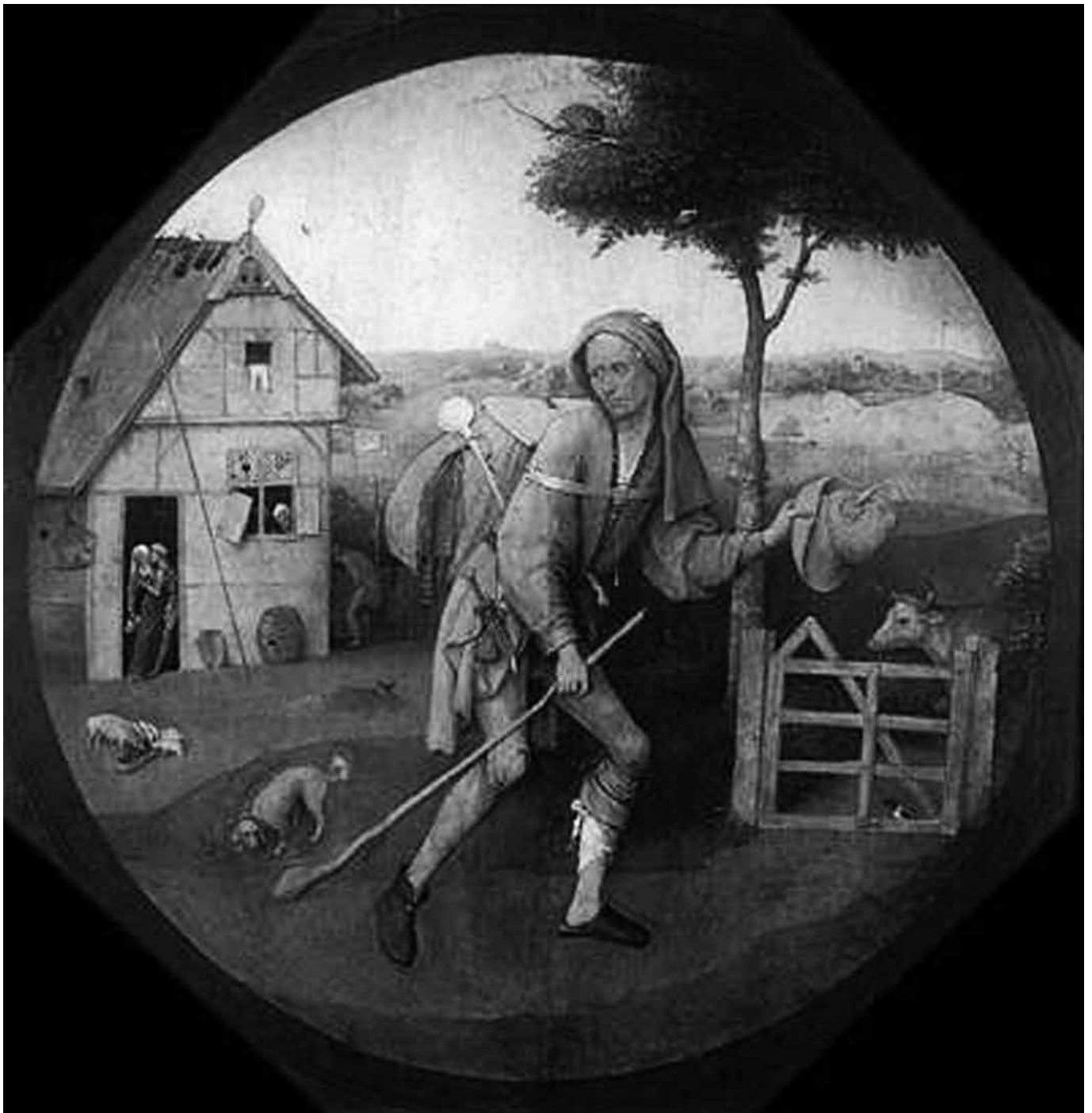
De verloren zoon in de visie van Jeroen Bosch. Hij verliet zijn ouderlijk huis met zijn vaderlijk erfdeel, raakte in den vreemde aan lager wal en moest daar leven tussen de varkens.