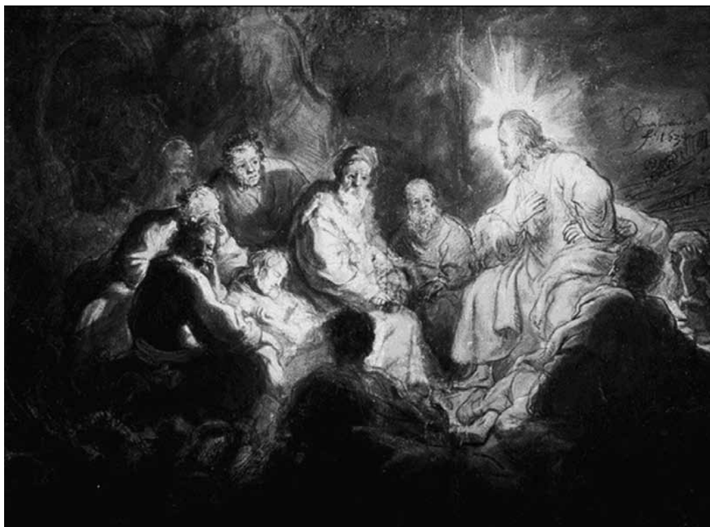
De door en door Joodse Jezus was een groot parabelverteller. Deze tekening van de predikende Jezus is van Rembrandt.

Het detail van de uitlopende vader kent dan ook een frappante parallel in een rabbijnse parabel: