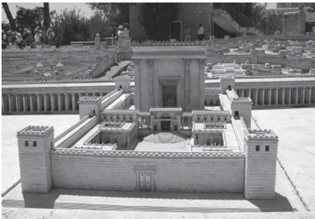
Maquette van de binnenhof van de tempel van Herodes, met westelijk het Heilige der Heiligen. Deze maquette stond tot 2006 in het Holy Hand Hotel in Jeruzalem.