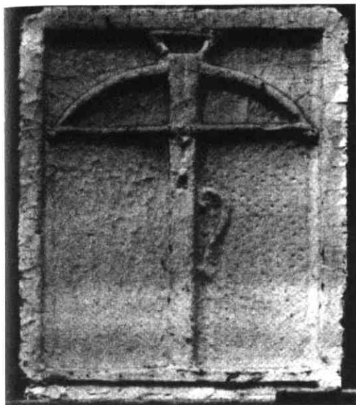
Handboog in ontspannen toestand op een gevelsteen te Weesp (uit: De gevelstenen spreken van J.R. Schiltmeyer. Amsterdam, 1970)