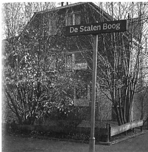
Het straatnaambordje zonder uitleg (dia: Marijke Donkersloot-de Vrij, 1994)

Hiermee werd gekscherend verwezen naar een mestvaalt die daar lag. Deze mest was afkomstig van veewagens van firma De Klein. Zo'n naam zou nu niet meer worden gebezigd. Men kreeg op een gegeven moment moeite met de uitgang 'steeg'. Zo werd in Werkhoven in 1952 de Achtersteeg veranderd in de Ambachtstraat en de steeg bij Van Echteld in de Weerdenburgselaan 5 .