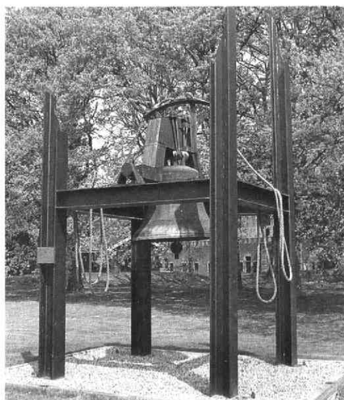
Luidklok (foto auteur 1994)

Muziekvereniging Constantia uit Werkhoven zorgt traditiegetrouw voor een passende muzikale omlijsting, waarbij ondermeer het Nederlandse en het Belgische volkslied worden gespeeld. Na afloop van de plechtig-