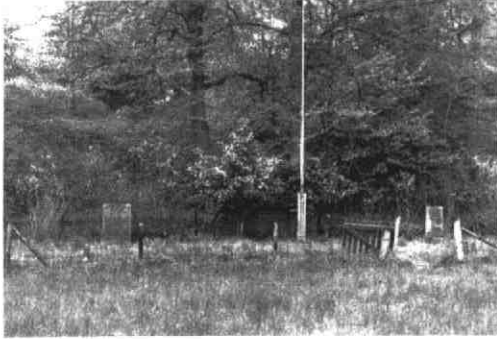
Herdenkingsmonument in verwaarloosde toestand

thaagse veldheer Hannibal, die met olifanten de Alpen was overgetrokken. Marine-officieren en hun 'madelieven' noemden hem daarom spottend Hannibal en het spel dat hij regisseerde het Hannibalspiel. Het spel eindigde in de herfst van 1942 met de arrestatie van 80 verzetsmensen. Hiervan werden er elf op 9 oktober 1943 op het fort bij Rijnauwen gefusilleerd.