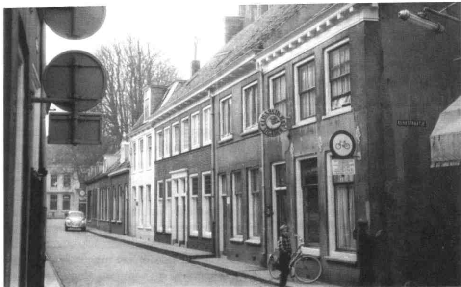
'De Zeven Huisjes' gezien vanuit de Peperstraat op een foto uit ca 1970