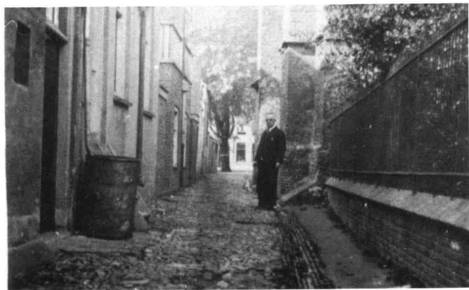
'Achter de Zeven Huisjes', het straatje tussen de Peperstraat en de Grote Kerk op een foto uit ca 1950 (?)

1. Met 'De Zeven Huisjes' worden de eerste zeven woningen bedoeld aan de linkerkant van de Peperstraat komende van de Markt, tegenwoordig genummerd