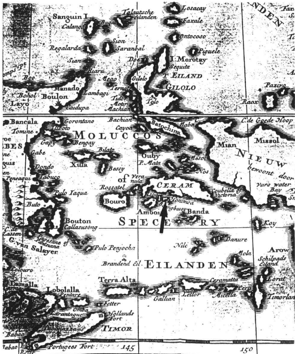
Gedeelte van een kaart van zuid-oost Azië, uitgegeven door Isaak Tirion, 1736 (uit: Hedendaagse historie of tegenwoordige staat van alle volken). Fort Duurstede lag op het eiland Honimoa dat op dit kaartfragment is aangegeven.