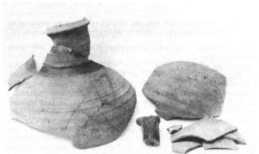
afb. 10. Vondsten gedaan door de archeologische werkgroep onder Brink 2 te Schalkwijk.