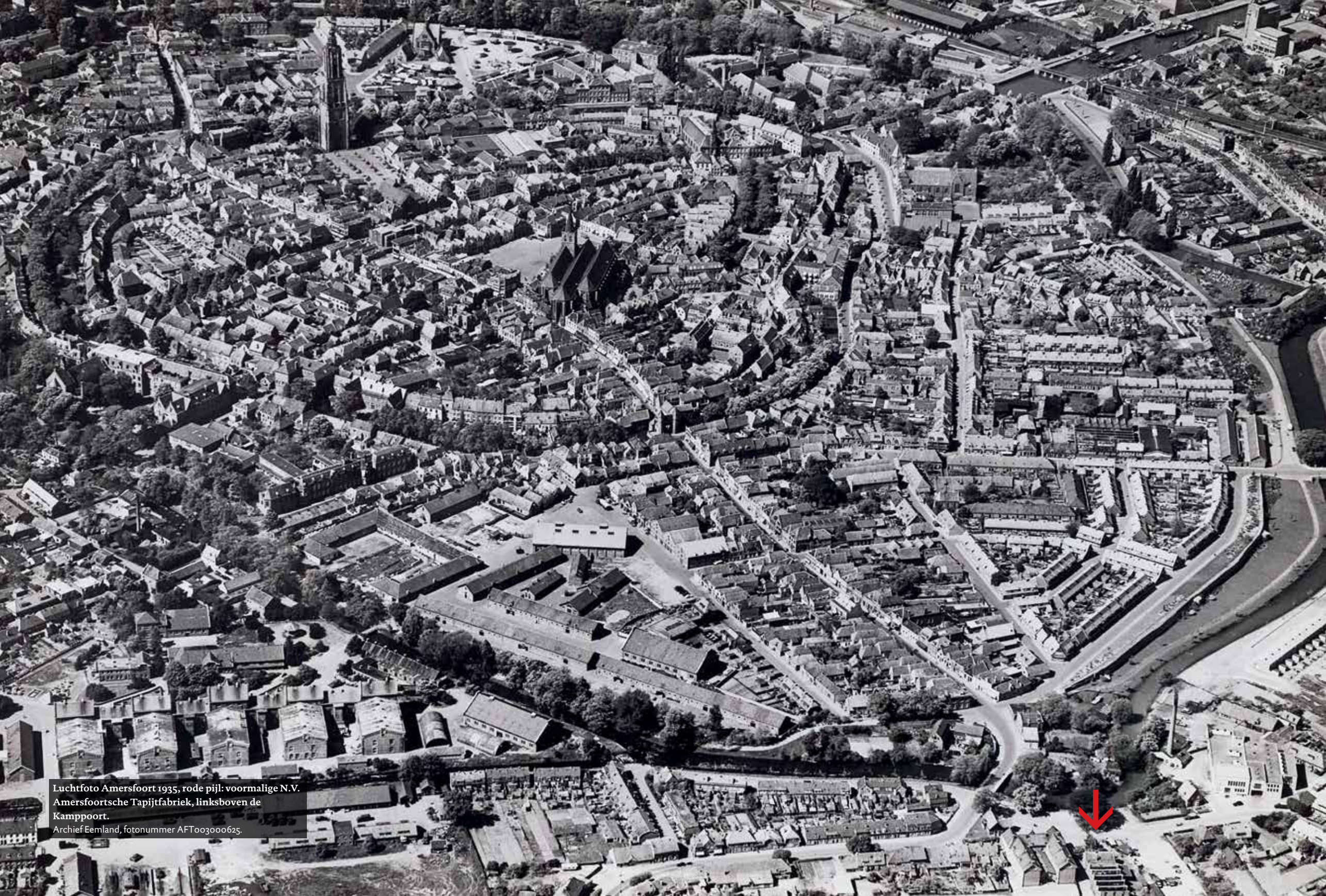
Luchtfoto Amersfoort 1935, rode pijl: voormalige N.V. Amersfoortsche Tapijtfabriek, linksboven de Kamppoort. Archief Eemland, fotonummer AFT00300625.