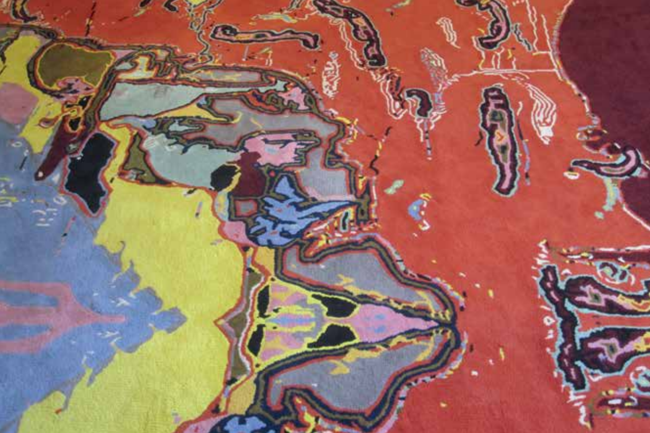
Detail tapijt 'Visschen/Poissons', KVT-remake van Colenbrandertapijt voor H.W. Mesdag uit ca. 1893.