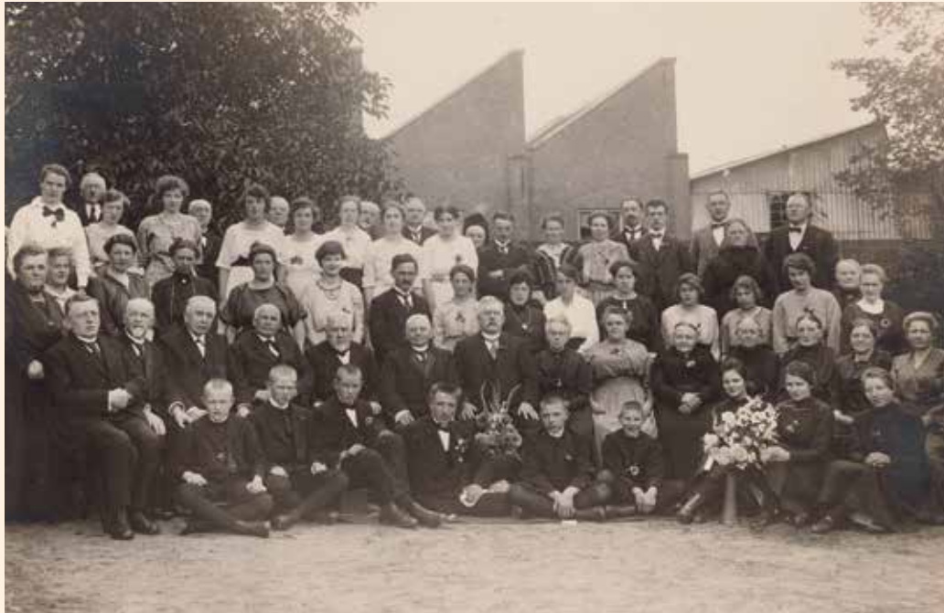
Groepsfoto van wezen en bestuurders uit 1922 genomen in de tuin van het Gereformeerd Weeshuis met de fabriek van Garjeanne op de achtergrond.