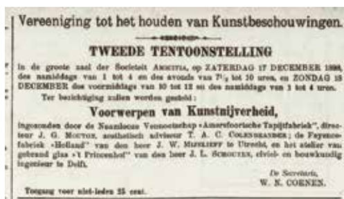
Rotterdamsch Nieuwsblad, Nationale Tentoonstelling van Vrouwenarbeid , 23 juli 1898.