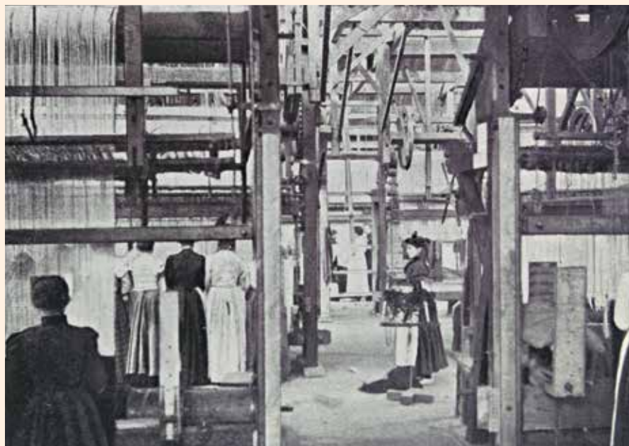
Vrouwen staan aan het werk in de N.V. Amersfoortse tapijtfabriek.