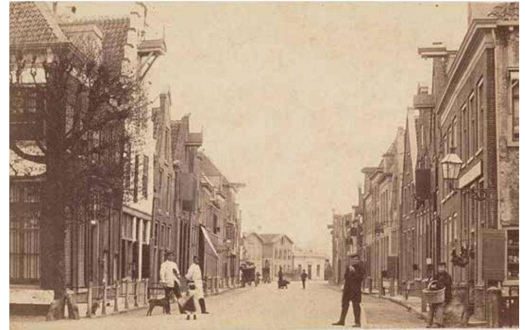
Woonhuis Garjeanne op de Kamp 44, links op de hoek.

Hoewelakense Voetpad, van W. van Haselen. 11 Er volgde nog een aanzienlijk aantal bedrijven die zich in het pand vestigden. 12 De meest bekende firma die op dit perceel gevestigd is geweest, is die van J. en H. Polak uit Amsterdam, die in 1914 een Hinderwetvergunning aanvragen 'tot het oprichten van eene inrichting tot het vervaardigen, verwerken en bewerken van producten voor de fabricatie van etherische oliën, vruchtenessences en reukstoffen (met uitzondering van muskus)' voor perceel Sectie A, nummer 1551; beter bekend als