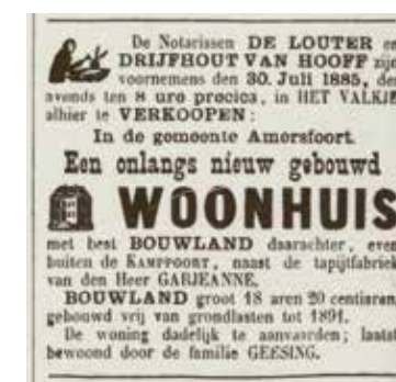
Advertentie verkoop woonhuis.

Wanneer na 1901 de N.V. Amersfoortsche Tapijtfabriek opgaat in de Koninklijke Tapijtfabriek