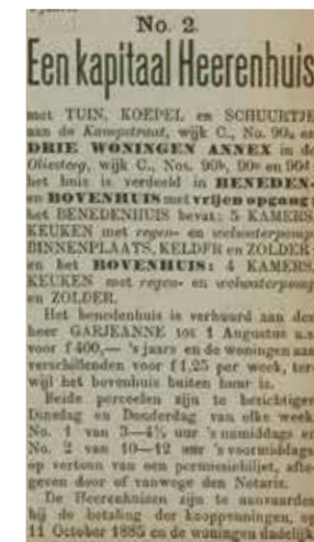
Advertentie Heerenhuis. Amersfoortsche Courant, 09/07/1885 p. 4/4; Archief Eemland.

het latere PFW, Polak's Frutal Works. 13 De fabriek op de luchtfoto uit 1935 is dus met zekerheid de N.V. Amersfoortsche Tapijtfabriek, waarvan het