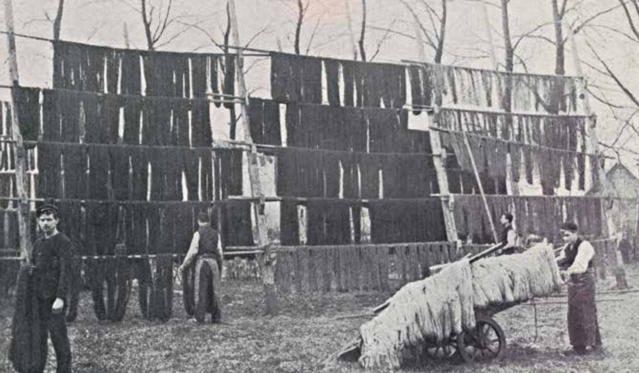
Geverfde wol hangt te drogen aan de Lageweg in Amersfoort.