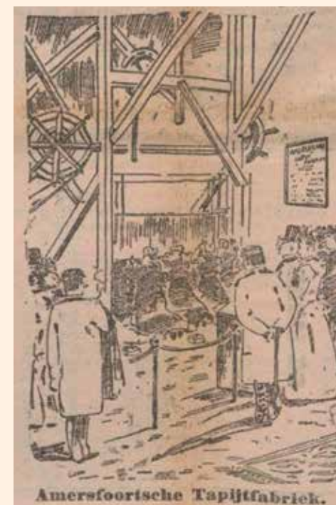
Rotterdamsch Nieuwsblad, Nationale Tentoonstelling van Vrouwenarbeid , 23 juli 1898 (KB).