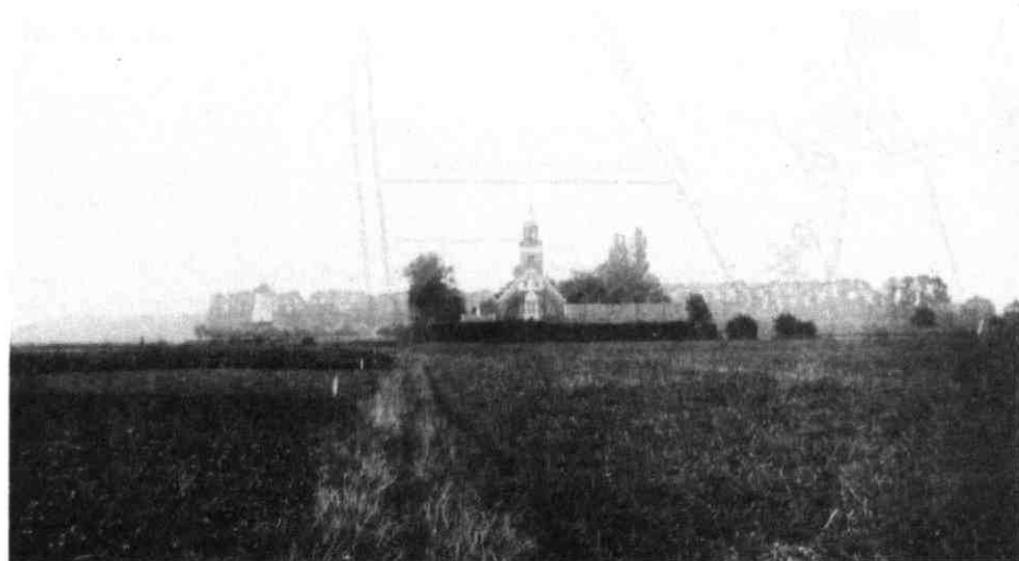
afb. 6. De nieuwe molen te Werkhoven met rechts de oude Katholieke kerk ca. 1890.

De molen lag daar aan de Kromme Rijn enerzijds uitstekend i.v.m. het vervoer van graan per schip maar anderzijds slecht want de molen stond