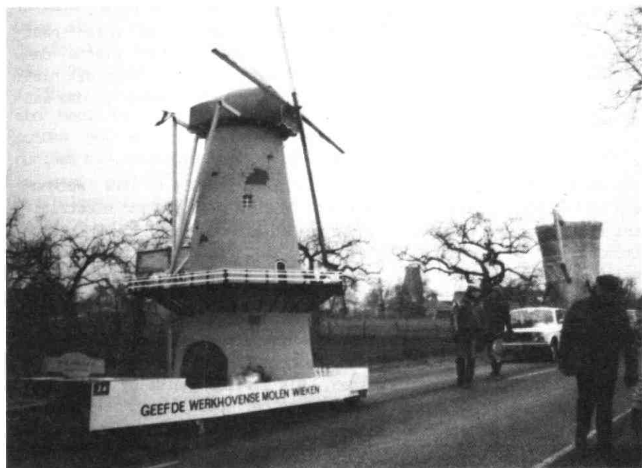
afb. 8. De molen in 1986 nagebouwd door Jong Nederland. Midden op de achtergrond de echte molen zonder wieken.