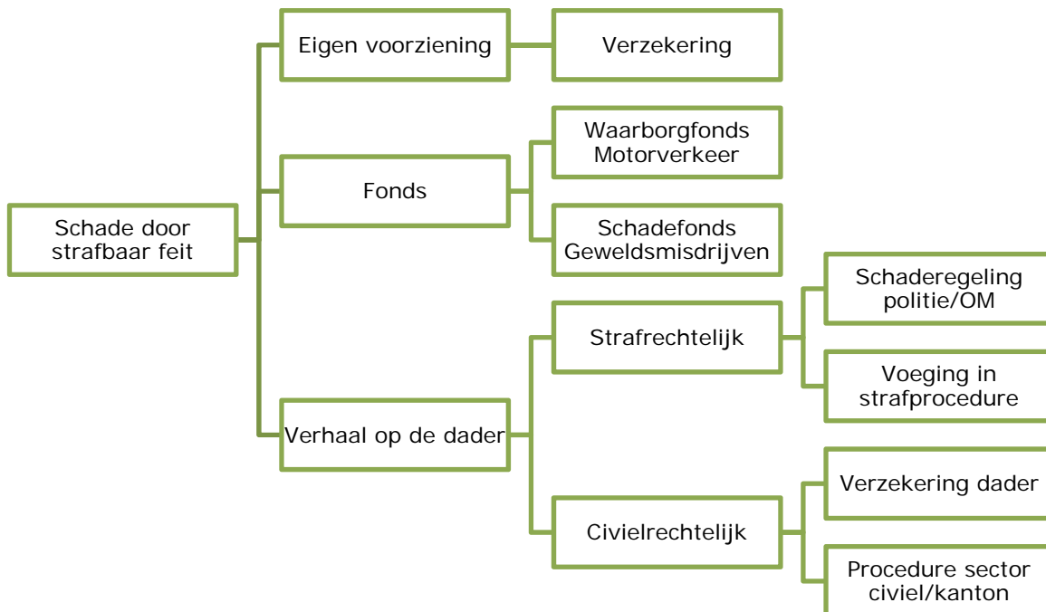
Figuur 1: Routekaart voor schadeverhaal na een strafbaar feit