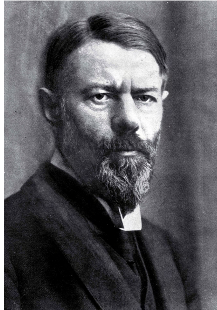
Duitse socioloog Max Weber, 1864-1920.