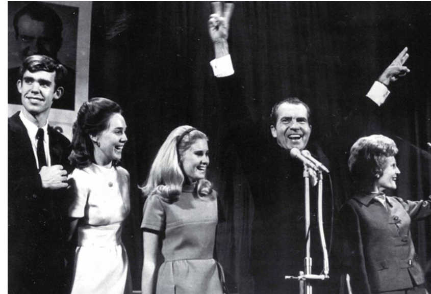
De tot president van de Verenigde Staten gekozen Richard Nixon, met zijn echtgenote Pat, dochter Julie en Tricia en schoonzoon David Eisenhower, 1969.

Ook de onthulling van de Pentagon papers had een dergelijk effect. Daaruit bleek dat vier achtereenvolgende regeringen met een beroep op de nationale veiligheid op eigen houtje de oorlog in Vietnam hadden uitgebreid, en ook operaties tegen Laos en Cambodja waren begonnen. Openlijk beled Nixon een einde te willen maken aan de oorlog in Vietnam, achter de schermen continueerde hij agressieve offensieven in allerlei nieuwe landen. De reactie van het Congres op beide onthullingen was dodelijk voor de