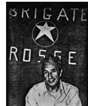
Foto van Aldo Moro, verspreid door zijn ontvoerders, 1978.

1978 door de Brigade Rosse werd ontvoerd en na een gevangenschap van 55 dagen alsnog werd vermoord, niet de linkse, verzoenende figuur binnen de regering-Andreotti was, zoals hij postuum werd afgeschilderd. Moro was vóór hardere veiligheidsmaatregelen en repressieve wetten. Dat feit alleen al helpt ons om kritische