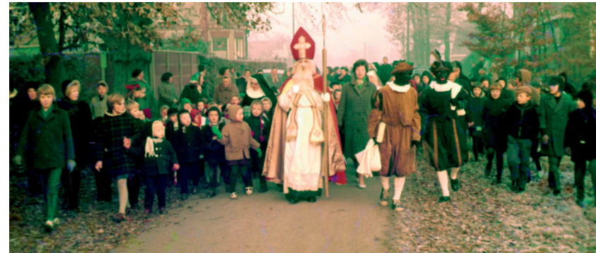
Intocht van Sinterklaas in de jaren vijftig in het Overijsselse dorpje Haarle.

Archiefonderzoek naar historische bedreigingen en naar historische praktijken van geheimhouding leert ons een lesje over verspilling van tijd, middelen en energie in de strijd tegen windmolens. Het leert ons ook dat die windmolens voor tijdgenoten wel degelijk een groot gevaar vormden. Ik wil hier niet post hoc, met de kennis van nu, een oordeel vellen over gebrek aan oordeelsvermogen van historische personen. Dat doet geen recht aan hun kennishorizon en aan de oprechte angsten voor bijvoorbeeld het Russische gevaar of voor de kernbom. Maar het laat wel zien dat óók toen al een tijdiger evaluatie van en een publieke verslaglegging over wat er dan als gevaar werd beschouwd, en wat de criteria voor uitbreiding van maatregelen of geheimhouding waren, wellicht tot meer terughoudendheid, minder hooggespannen verwachtingen, minder publieke opschudding en minder schade aan burger- en grondrechten hadden geleid.