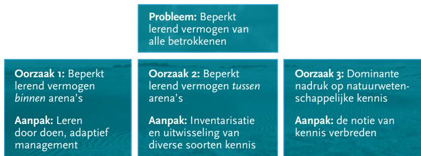
Figuur 2 Het beperkt lerend vermogen verklaard door drie oorzaken