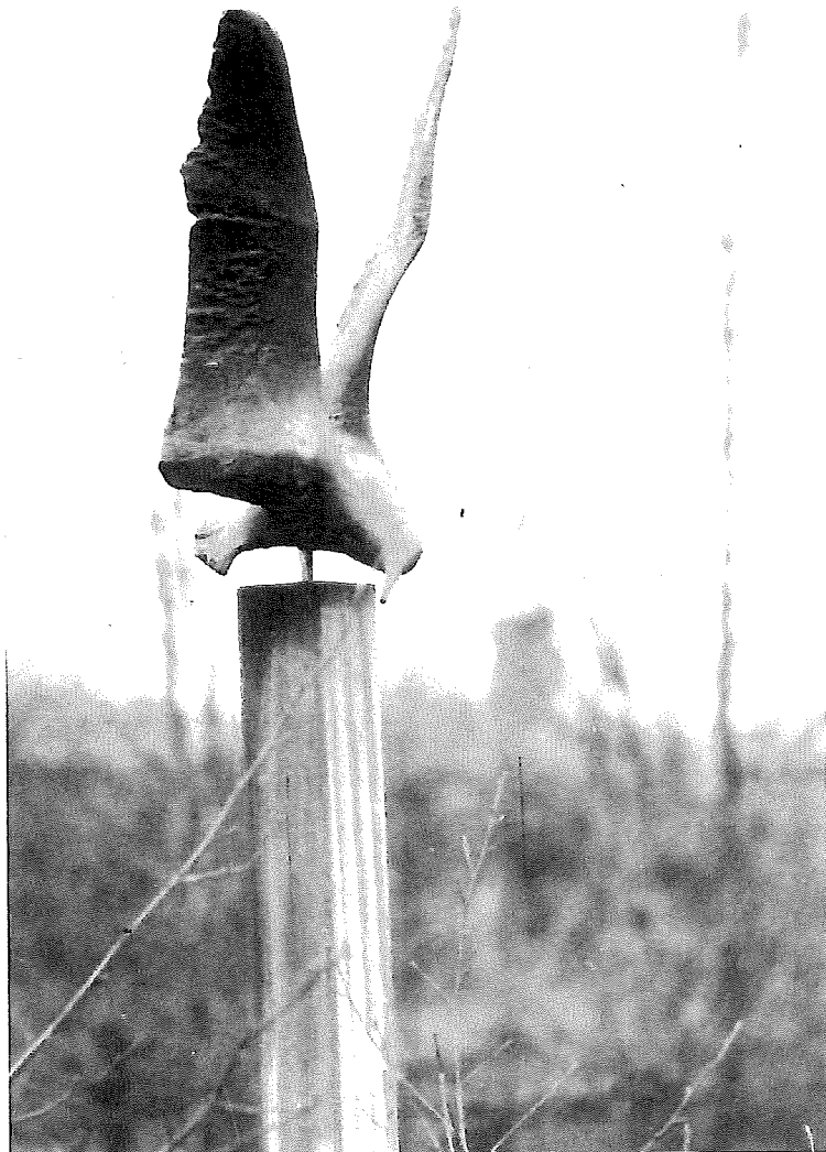
De Meeuw bij de slootovergang in Achter de Kerken.