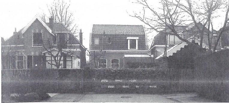
De niet gerealiseerde ontsluiting. Hier loopt de straat abrupt dood! Achter het attentiebord de woning Koppeldijk 11

te gaan. Overigens zou die doorgang bij de garages nog al eens moeilijkheden opleveren: de firma Albers schortte meer dan eens het recht van overpad voor de bewoners op. Dit had te maken met een conflict dat Albers met de gemeente had. Volgens het bestemmingsplan was er namelijk een ontsluiting gepland ter hoogte van Koppeldijk 11, het huis dat eigendom was van de familie Wouters. Om het te slopen betaalde de firma Albers fl. 5000,- aan de gemeente. De ontsluiting werd geschrapt, maar Albers kreeg zijn geld niet terug. Het vertroebelde de relatie tussen de bouwers en de gemeente, hetgeen niet zonder gevolgen zou blijven. Nog in 1988 ontstond er commotie toen Albers een hek plaatste van twee meter hoog en bewoners van Angsteloord verbod gebruik te maken van de eerder genoemde doorgang. Op 29 februari 1960 draagt de firma Albers de grond voor wegen en plantsoenen in de wijk over aan de gemeente.