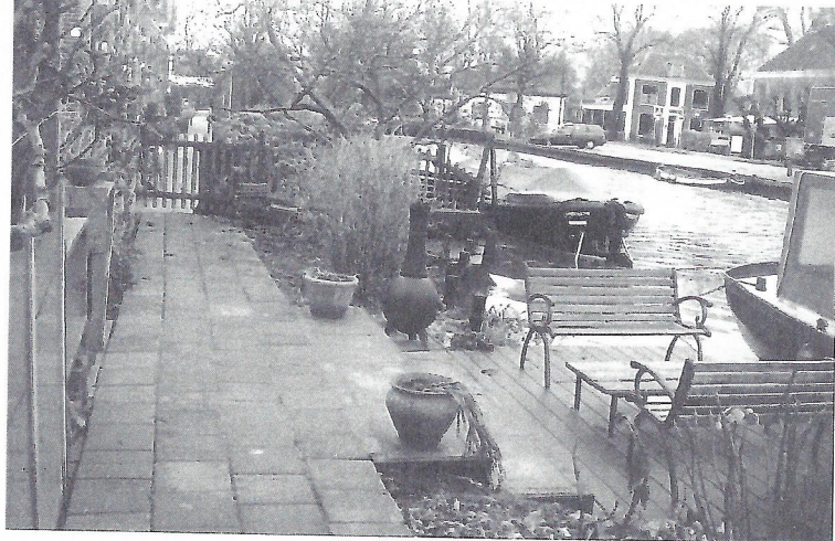
Vanaf de Angstelkade naar de Koppelkade is het hekje een niet te nemen barrière. Bewoners van Angsteloord hielden het doortrekken van de Koppelkade tegen.

De Beaufortlaan en de Doude van Troostwijkstraat waarmee in Koppeland was begonnen.