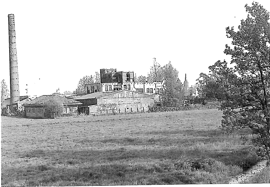
De schoorsteen van de Motex domineerde lange tijd de noordoosthoek van het Meer.