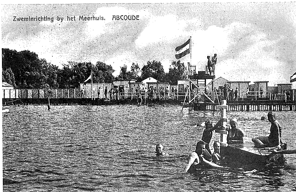
Zweminrichting bij het Meerhuis met duiktoren en zwemvlot.

de afbakening ook verband met de vraag hoe de grens over het meer moest worden ingevuld.