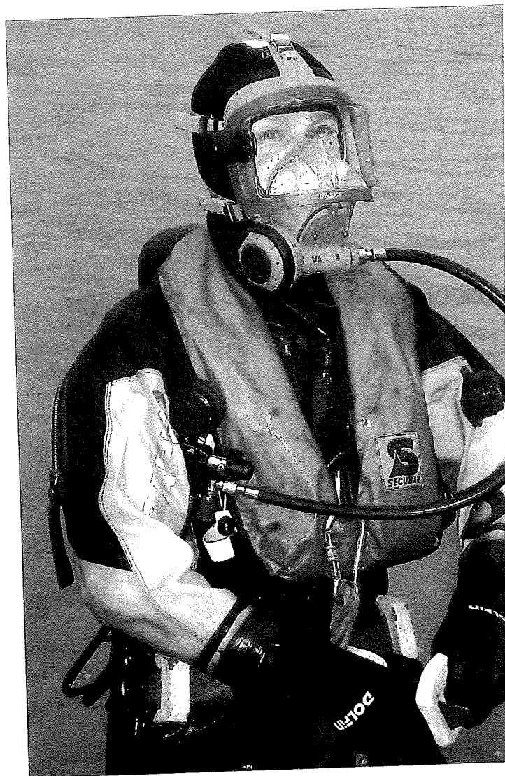
Geen vogelgelaatmaser maar volgelaatmasker.

Vroeger dook men in een zogenaamde "natpak". Dit was een op maat duikpak gemaakt. Wan-neer een duiker te water ging, kwam er een laagje koud water tussen het lichaam en het duikpak. Dit water werd verwarmd door het lichaam. Dat duurde ongeveer 30 seconden. Tegenwoordig mag dit niet meer vanwege het vervuilde water dat nogal eens wordt aange-troffen. Een brandweerduiker duikt vandaag de dag met een zogenaamd droogpak. Een dergelijk pak trekt men over de kleren aan met een daarbij horend onderpak tegen de kou. Je wordt dus niet meer nat en minder snel koud