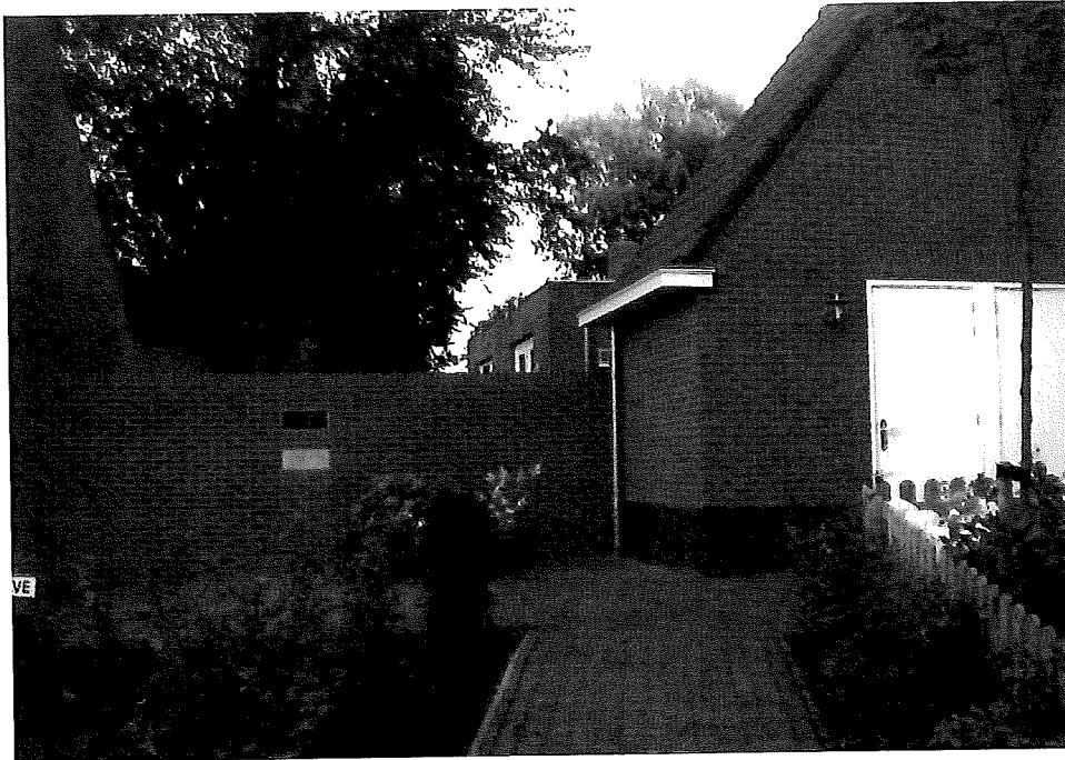
De verbindingsmuur aan Kerkgaarde met daarin de twee stenen.

uitgezakt. De muren zijn vochtig als gevolg van optrekkend en doorslaand vocht. De begane-grond vloeren, direct op zand aangebracht, verkeren in slechte staat. Het hout van ramen, deuren en kozijnen is eveneens slecht. De woning nr. 9 (oud 36) is thans onbewoond. Ik ben van mening, dat de woningen ongeschikt zijn ter bewoning en niet door verbetering in bewoonbare staat te brengen. Ik geef u in overweging aan de gemeenteraad voor te stellen de woningen Kerkstraat 5,7 en 9 (oud 40, 38 en 36) in uw gemeente onbewoonbaar te verklaren. Als motieven voor deze onbewoonbaarverklaring kunnen worden aangevoerd: Oude vervallen toestand gebrekkige indeling vochtigheid onvoldoende bescherming tegen weersinvloeden geringe verdiepingshoogte lage ligging van de vloer ten opzichte van de straat.