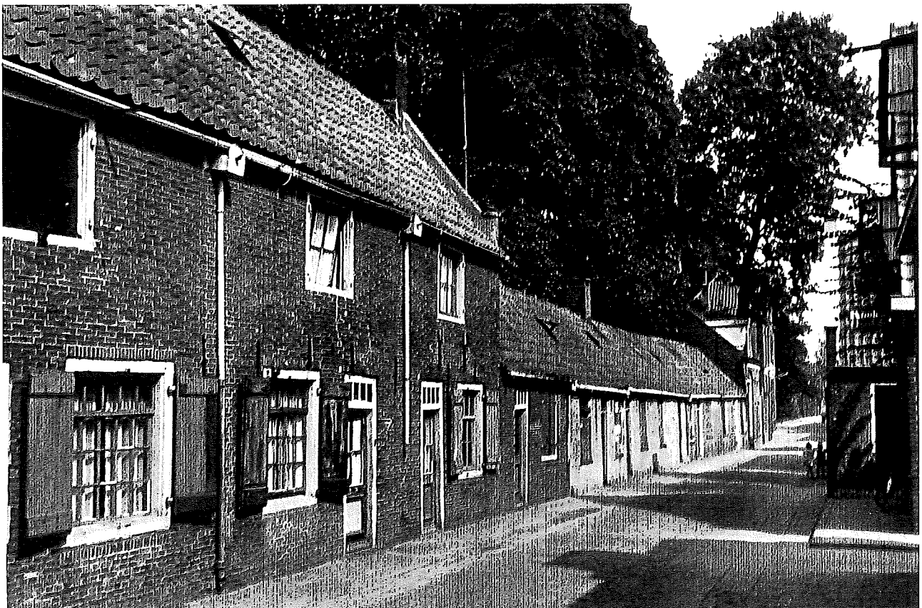
Op de voorgrond de particuliere Muurhuizen daaraanvolgend de lage RK Muurhuizen.

De eerste vier, wat grotere pandjes waren particulier eigendom. De volgende vijf panden behoorden bij het bezit van het RK Armen parochiaal bestuur. De bewoners daarvan konden in het algemeen tot de minvermogenen gerekend worden. Kenmerkend voor de woningen was, dat aan de achterzijde geen