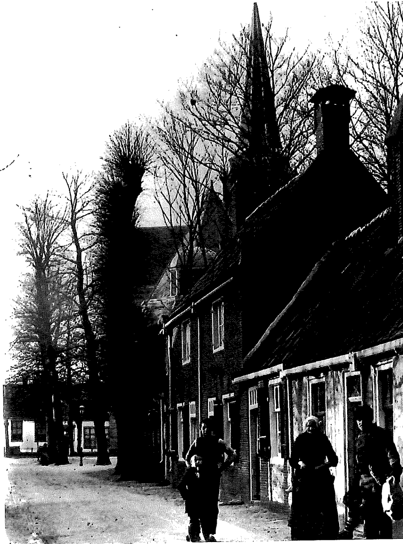
Op de achtergrond de hoge particuliere Muurhuizen. Op de voorgrond de lage RK Muurhuizen.

Uiteindelijk kocht de gemeente de pandjes nrs 5,7 en 9 met berging in 1957 voor een som van fl. 9.000,--. Eerst had zij nog geprobeerd het RK Armbestuur te laten bijdragen. Maar dat lukte niet. Zij schreven dat door de bouw van de bejaardenwoningen hun financiële draagkracht