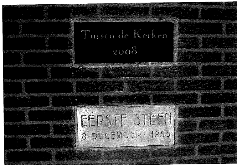
De twee recent geplaatste memoriestenen. De onderste is de oudste.

De inrichting der huisjes is als volgt: zijkamer, slaapkamer, keuken en portaal. Allen zijn voorzien van een badcel met lavet en vaste wastafel. Colorite(Vinyl) tegels zullen de vloeren bedekken. De hallen, WC's en badcellen zullen van betonemaille worden voorzien. Het geheel ontworpen door de architect dhr. G.A. van Bueren uit Zeist is zeer modern en ziet er uitstekend uit. Het zal een