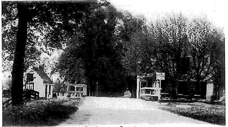
De Coupure, vooandbrugge.

De remedie leek dus voor de hand te liggen. Besmette beesten direct isoleren en in het uiterste geval afmaken en het kadaver vernietigen en onbruikbaar maken voor consumptie of handel. Maar dat lag, gezien de bestaande wetten, niet zo eenvoudig. Een wet die het mogelijk maakte om besmette koppels vee binnen 24 uur na ontdekking van de besmetting af te maken en te begraven ontbrak. Wel stelden de Staten Generaal een krediet van honderd-duizend gulden beschikbaar voor onteigend en afgemaakt vee. Verder werd de Regering een paar maanden later gemachtigd om beperkte verordeningen uit te vaardigen aangaande veemarkten, de handel in vee en van wat als overbrenger van smetstof beschouwd kon worden. Eigenlijk halve maatregelen, die de verspreiding niet deden stoppen maar hooguit vertraagden. Daarenboven stonden de veehouders niet te trappelen om alle voorschriften strikt te volgen, deels uit onwetendheid, deels uit baatzucht. Zij wisten dat als je het vee liet uitzielen, een deel overleefde. Dus waarom zou je je hele veestapel laten afmaken? En vergeet niet dat er ook veehouders waren die op religie geënte gemoedsbezwaren hadden. De Wrake Gods of Onnatuurlijkheid weerhield hen van het toelaten van ingrijpen door overheden.