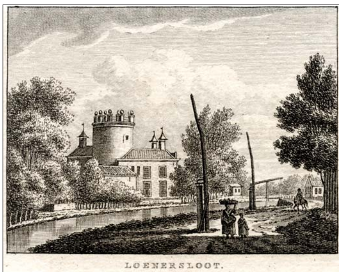
Kasteel Loenersloot begin 19de eeuw.