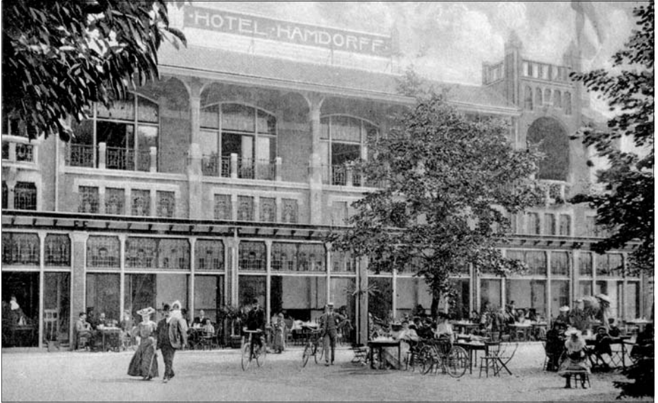
Hotel Hamdorff in Laren na de grote uitbreiding in 1912.