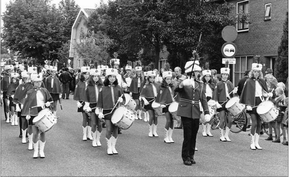
Optreden van de drumband "In Aethere Musica", aan de Wakkerendijk (1976).