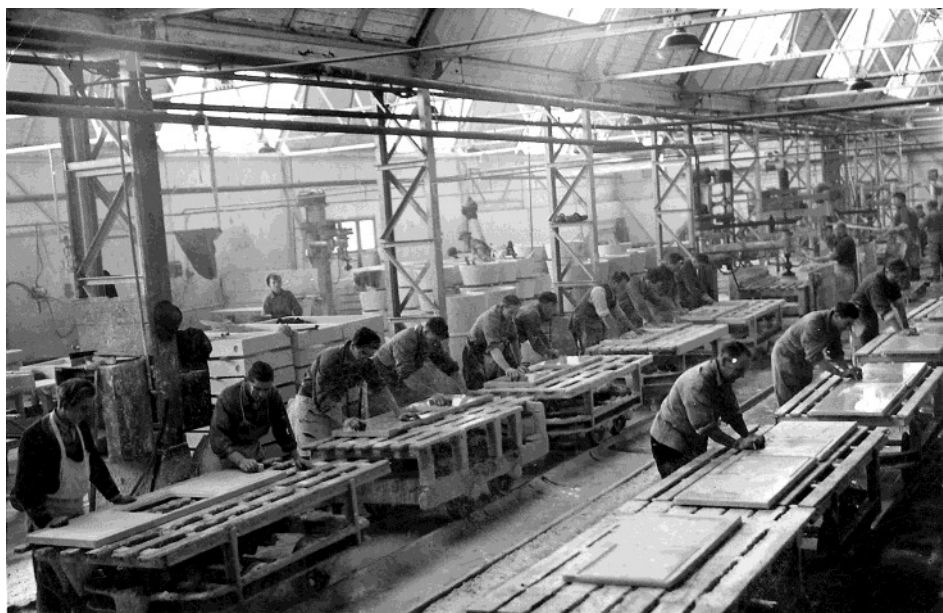
Productie van aanrechtbladen in hal 3 in 1949. De werkwijze was hier nog gelijk aan 1943. Men beseft niet, dat bij het slijpen van Oeriet bescherming nodig was tegen stof in de longen.

dicht bij de grens met de gemeente Baarn. Eind 1939 zijn er op het complex aan de Eem zo'n 15 mensen aan het werk. Door de oorlogsdreiging loopt vanaf september 1939 de omzet van aanrechten terug. Dat blijft zo na de inval van Duitsland in mei 1940 en gedurende de rest van de Tweede Wereldoorlog. Vergeleken met de huidige lonen is het inkomen dan heel laag: in 1943 inclusief toeslag voor het soort werk \pm f 0,45 per uur waardoor men in de normale werkweek van 54 uur op \pm f 25,- per week komt (huidige waarde € 142,-). Van der Eerde maakt van de nood een deugd en verdiept zich in de te verwachten veranderingen in het wonen. Samen