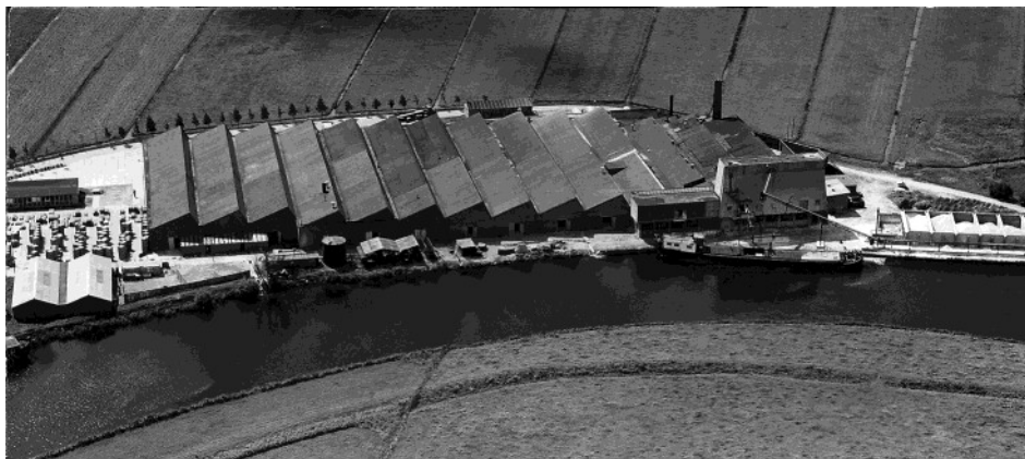
Beeld vanaf het oosten in 1958. Er zijn nu al 14 beuken met sheddak, terwijl het oude rechthoekige gebouw moest wijken.

uit het schip bovenop de silo. Zand en grind werd niet meer van buiten uit grote opslagbakken gehaald, maar werd binnen op lorries gestort, via trechters met afsluiters aan de onderkant van de silo. De fabriekshallen werden uitgebreid. In 1955 waren er al 10 beuken met sheddak, doordat er aan de zuidkant 7 beuken waren toegevoegd. Voor die uitbreiding was de Zomerdijk en de daarop liggende Eemweg verlegd. Daarna is er in twee stappen verder uitgebreid met kortere beuken aan de oostkant van het terrein: vier ± 1956 en acht ± 1967. Het totaal aantal beuken met sheddak was toen 22. Voor de laatste uitbreiding zijn er aan de zuidkant percelen grond bijgekocht en is de Eemweg daar nog eens verlegd. Zo is de situatie nog in 2010.