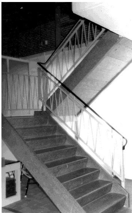
Evenals Lavetten, werden trappen van Ocriet in heel veel flatgebouwen geleverd, onder andere in de Bijlmermeer. Hier een trap op een bouwbeurs te Utrecht, in de stand van de Ocrietfabriek.