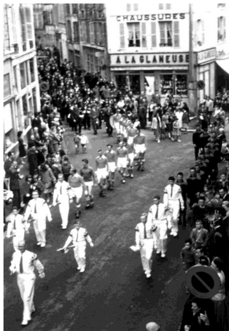
Na het besluit voor een Ocrietfabriek in de Franse plaats Tonnerre (Yonne), bracht in mei 1959 een grote delegatie van Ocriet een bezoek voor kennismaking met Tonnerre. De foto geeft een beeld van de optocht door het stadje. In het midden het voetbalteam van Ocriet en vóóran leden van muziekcorps Excelsior uit Baarn.