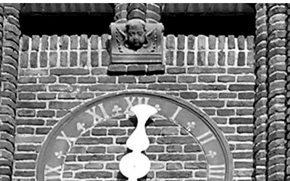
De Pieterskerk van Eemnes-Binnen, gebouwd na verkrijging van het stadsrecht in 1439, ging omstreeks 1612 over naar de 'gereformeerden'. Beelden werden verwijderd uit de kerk, het engeltje boven het uurwerk bleef rustig zitten.

burgerij, zaten vermoedelijk grotendeels katholieken. Omdat dit een typisch dorpscollege was, waren hier door de Staten van Utrecht geen nadere bepalingen voor gemaakt. Dat deze situatie de katholieken hoog zat, blijkt na de komst van de Fransen, die vrijheid van religie brachten. In 1795, het begin van de Franse tijd, zijn alle functionarissen hervormd. In 1796 verandert dat rigoureu: in beide dorpsbesturen is nog één hervormde gekozen, het jaar daarop niet één meer. In het begin van de 19 e eeuw worden vroegere, hervormde bestuurders in functie hersteld en maken personen van beide religies weer deel uit van de dorpsbesturen. 35