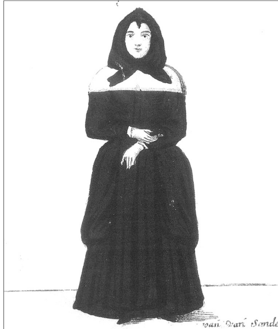
Een klopje, zoals die volgens deze tekenaar gekleed ging. Het onderschrift luidt: 'Dit que-sels kleet weet sij te dragen om Godt better te behagen.' Uit het vierde kwart van de 17 e eeuw zijn de namen van zes 'geestelijke dochters' uit het doopboek als doopgetuige bekend.

In 1642 wordt er bij de aanhouding door de schout van de priester Florentius van Vianen gesproken over twee klopjes te Eemnes. In de brieven van baljuw P.C. Hooft staat echter, dat dit in Blaricum gebeurde. 32 In Eemnes hebben zeker in de tweede helft van de 17 e eeuw meerdere klopjes gewoond: tussen 1676 en 1689 worden er verschillende ‘devote of geestelijke vrouwen’ in het doopboek als doopgetuige genoemd.