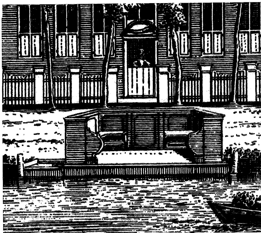
Afb. 1: De visstek van het onnozele schaepe