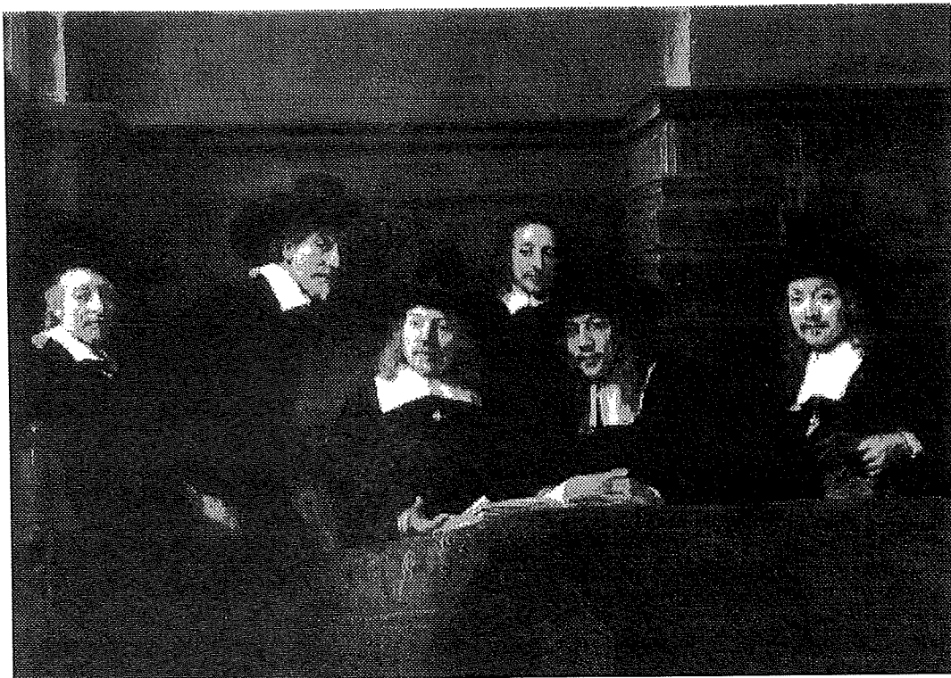
De Staalmeesters van Rembrandt van Rijn; Rijksmuseum Amsterdam