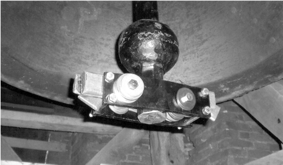
Klepel grote klok met korte vlucht en hulpgewicht.

Het weer in oorspronkelijke staat teruggebrachte uurwerk moet, net als eertijds, met de hand worden opgewonden. Daarna loopt het zo’n 15 uur aan één stuk, waarna het opnieuw moet worden opgewonden. Natuurlijk zou je het graag wat langer zien lopen, maar door de beperkte hoogte van de hal van het gemeentehuis kunnen de gewichten minder hoog worden opgedraaid dan in een toren. Dat is dan ook de voornaamste reden waarom het uurwerk niet permanent