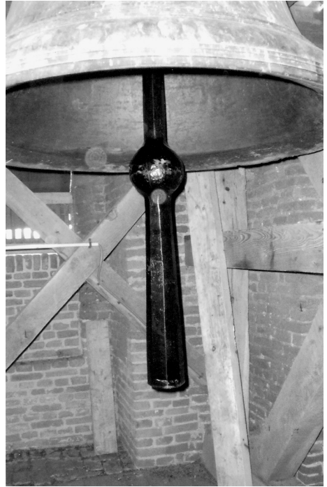
Klepel grote klok met lange vlucht.

Met de luidklokken in het Dikke Torentje doen zich nog steeds enkele problemen voor. Tijdens de ingebruikname op 5 mei wilden beide klokken pas luiden nadat de klepels provisorisch met hulpgewichten waren verzwaard (zie foto 1). Dit probleem werd veroorzaakt doordat de slingertijd van de klepels iets te kort was in vergelijking met de slingertijd van de klokken. Daarom plaatste de klokkengieterij Kon. Eijsbouts in september trager slingerende klepels met een extra lange vlucht (zie foto 2) maar dit veroorzaakte weer aanvaringen met de balken van de eikenhouten klokkenstoel. Voor de 'Gooi en Eemlander' waren deze problemen zelfs aanleiding tot het plaatsen van een artikel over een 'klepelcrisis' in het Dikke Torentje. Even zag het er naar uit dat de voor de