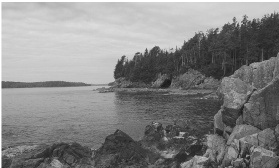
Wiebe eiland, een van de eilanden van de Broken Group Islands bij Vancouver eiland, aan de westkust van Canada.

Door latere vernoemingen is de naam Wiebe verspreid geraakt onder verschillende Eemnesser families, waaronder de families Heek, Dop, Dekker en Perier.