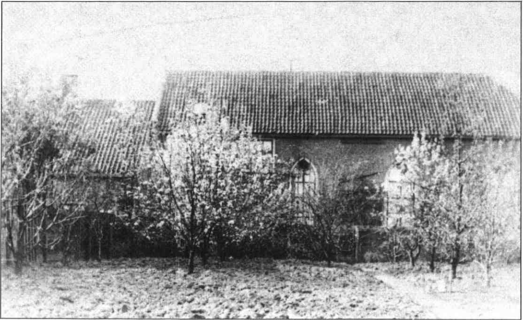
De schuilkerk aan de Havenstraat gezien vanaf de Walkade. Na 1888 is dit gebouw ingericht als gereformeerde kerk.

treffen we ook de preekstoel met de communiebank uit de oude kerk en ons 'Meereorgel'. Het verplaatsen geschiedt door de firma Gabry uit Gouda welke enkele reparaties uitvoert en twee nieuwe blaasbalgen plaatst voor een totaalbedrag van f 700,00.