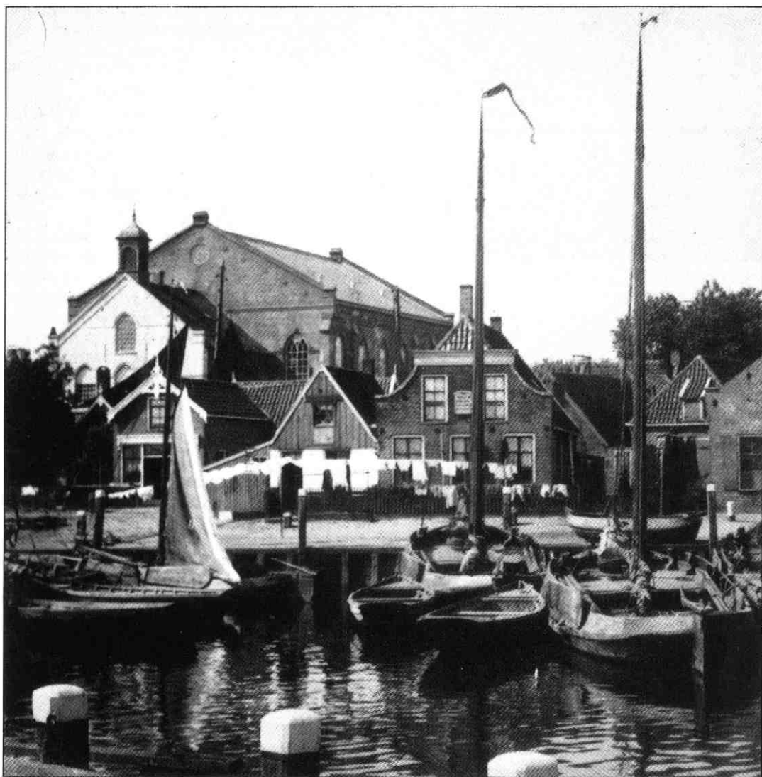
De Bethelkerk te Urk, gezien vanaf de haven.

dat kennelijk invloed, want in oktober 1909 overweegt de kerkeraad van de gereformeerde gemeente of het toch niet wenselijk is ook zo'n instrument aan te schaffen. Een paar maanden later besluit men de gemeente te laten beslissen, en dat gebeurt op 28 maart 1910 ten gunste van een orgel. Een benoemde commissie gaat aan de slag en komt in contact met een leverancier van gebruikte pijporgels. De firma Mart Vermeulen te Woerden had wel wat voor Urk en er wordt snel beslist