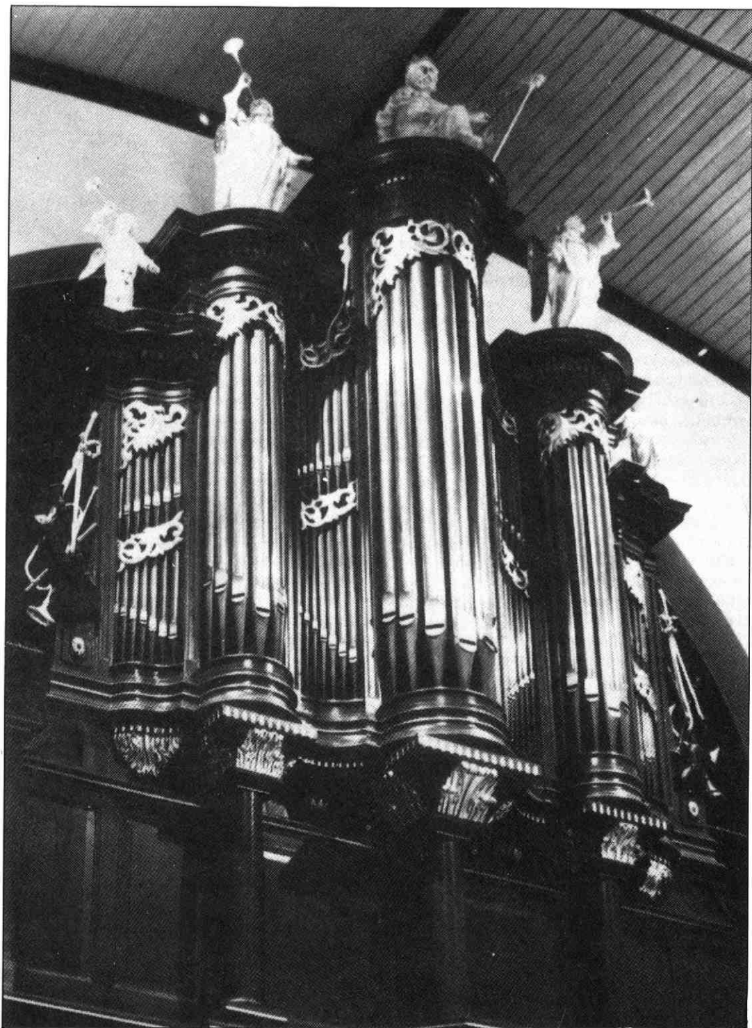
Vooraanzicht van het orgel, 1982.