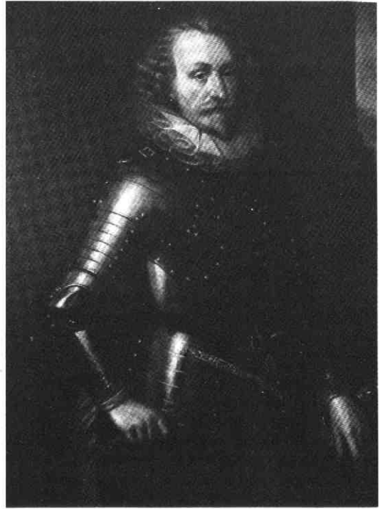
Philips van Hohenlohe (1550-1606).