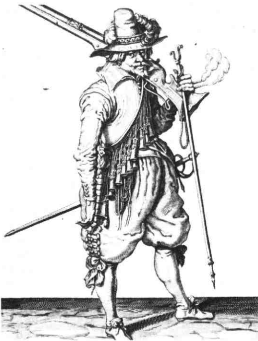
Afbeelding van een musketier (Jacob de Gheyn 1608).