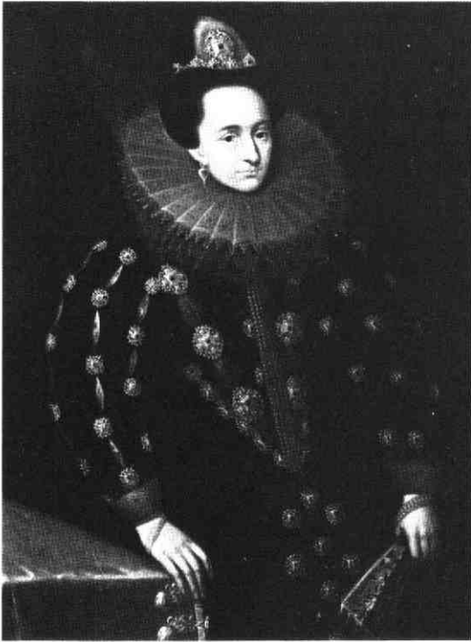
Maria van Nassau (1556-1616).