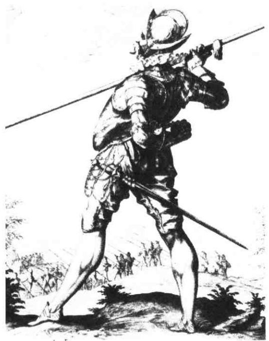
Afbeelding van een lansierpiekenier (Jacob de Gheyn 1608).

in ieder geval werd een vrijwel gelijklopende verordening in 1586 door Maria van Nassau afgekondigd. 21