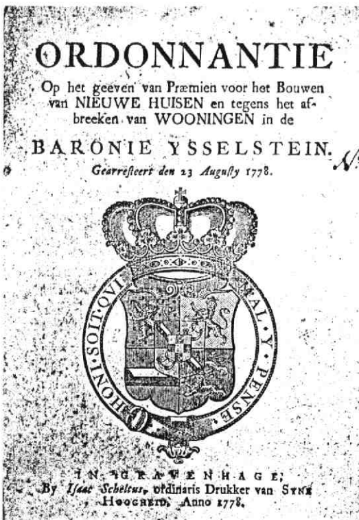
De openingspagina uit de gedrukte ordonnantie van 23 augustus 1778.