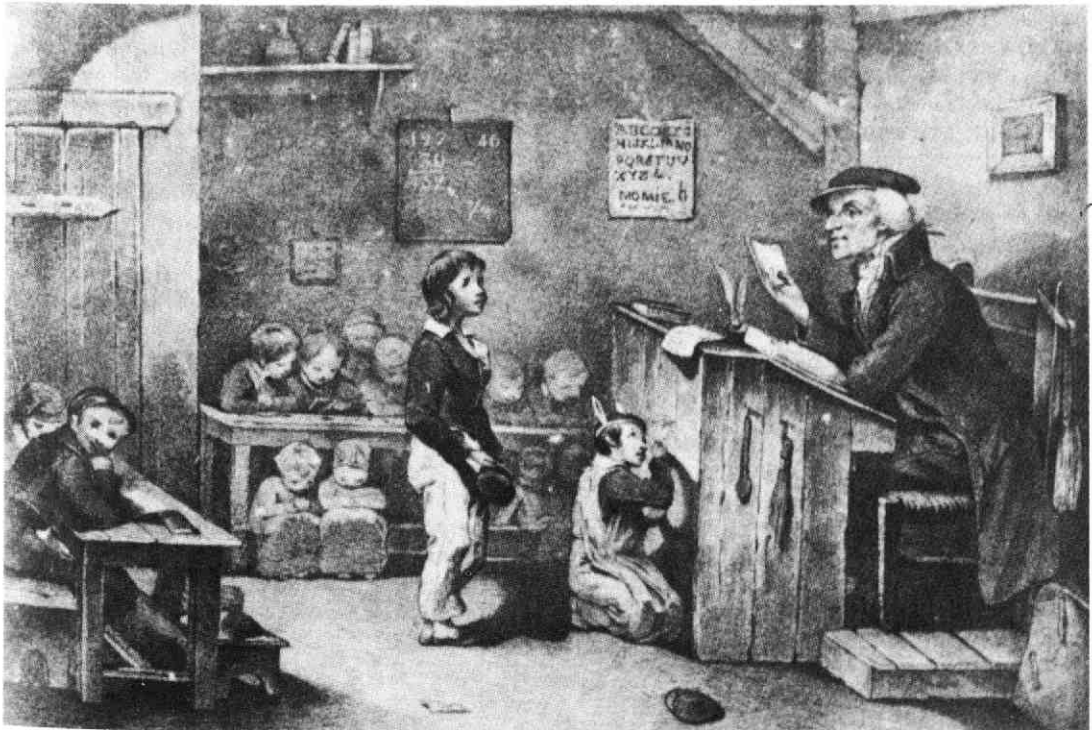
Een dorpschool uit het begin van de negentiende eeuw.

Zowel bij katholieke als bij hervormde ouders bestond blijkbaar de mening, dat het onderwijs op algemeen christelijke grondslag onvoldoende was voor hun kroost. Beide gezindten verzorgden daarom elk een aantal uren godsdienstonderwijs, weliswaar buiten het schoolgebouw maar binnen de schooltijd. De meeste weerstand tegen het karakter van het openbaar onderwijs was afkomstig van katholieke zijde. Al in 1817 constateert de schoolopziener de afwezigheid van veel kinderen vanwege de „Roomsche Katholieke leerling”. Maar vooral na 1832 maakt hij vaker een opmerking over het schoolverzuim om godsdienstige redenen. Het blijkt ook duidelijk uit het feit, dat kinderen van (de openbare)