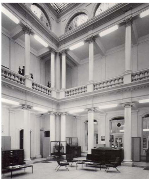
5 ► De hal van het Geografisch Instituut aan de Drift, dat tot 1969 de Utrechtse geografen huisvestte. Duidelijk zichtbaar is een hemelglobe en enkele ladekasten voor kaarten.

grafische literatuur aanschaffen, evenals vele kostbare facsimilewerken. Ook op het gebied van de aanschaf van origineel oud materiaal liet Koeman zich niet onbetuigd. Zo kon hij in 1976 met behulp van een speciaal geormerkt budget een grote slag slaan op de veiling van Beijers, waar de complete bibliotheek van het Koninklijk Instituut van Ingenieurs onder de hamer kwam. Tot de aankopen behoorden onder andere enkele fraaie atlassen met grootschalige rivierkaarten 1:10.000.