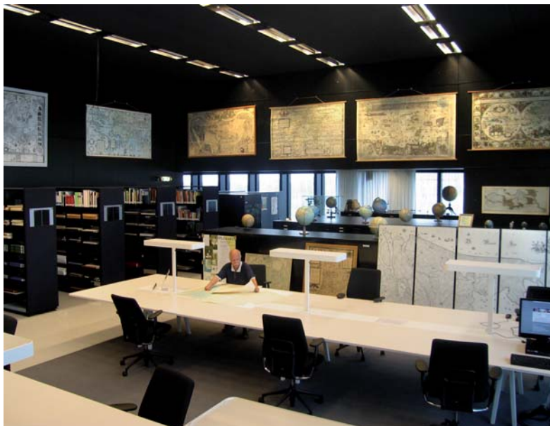
6 ▲ De huidige kaartenzaal in de Universiteitsbibliotheek Utrecht.