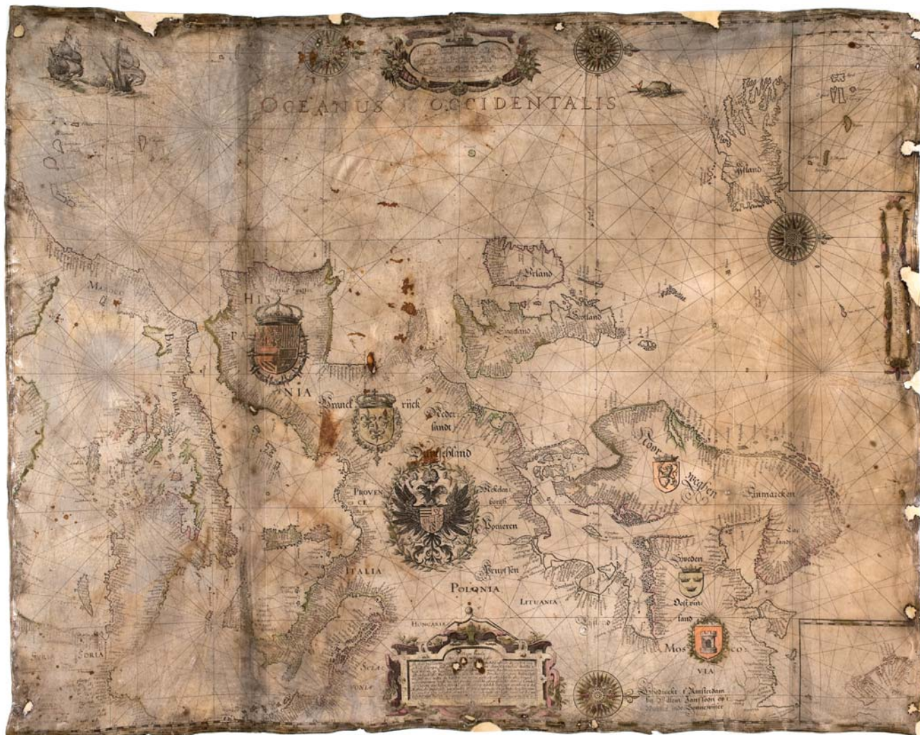
4 ▲ Paskaart van Europa door Willem Jansz Blaeu, gedrukt op perkament, ca. 1615 (Utrecht UB, KAART: *VIII*.N.d.2).