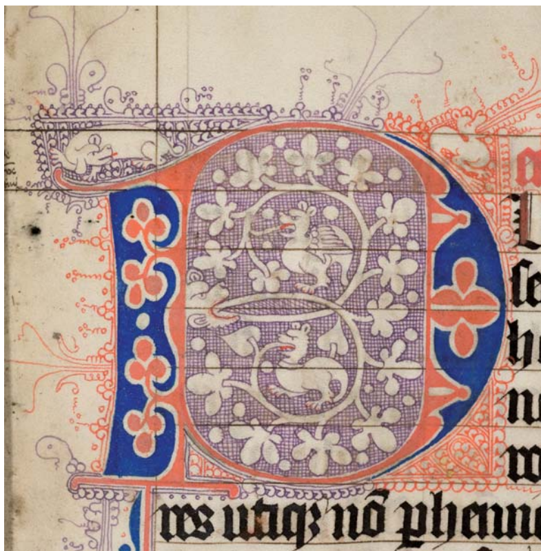
1 ▲ Draakje in de 'Martinellum'-stijl (Utrecht UB, Hs. 125, fol. 3r).

soms twee, soms vier, van een kat. Het is geen vreesaanjagend, vuurspuwend monster; uit zijn zachte snuit komt, in plaats van vuur, een bladrank of een bloem, reden waarom hij de liefkozende naam 'draakje' kreeg. Om deze zich in het oog van de initiaal vlijende, tamme en vriendelijke beestjes gaat het hier. Hun uiterlijk kan heel wisselend zijn; soms heeft het de kop van een vogel of van een slang, maar soms ook die van een hond of een schaap, waarbij de zo kenmerkende lange gebogen nek ineens is verdwenen. Zij zijn altijd met pen en inkt getekend en maken deel uit van de penwerkdecoratie, die zich verder rond de initiaal en over een of meer marges uitstrekt.