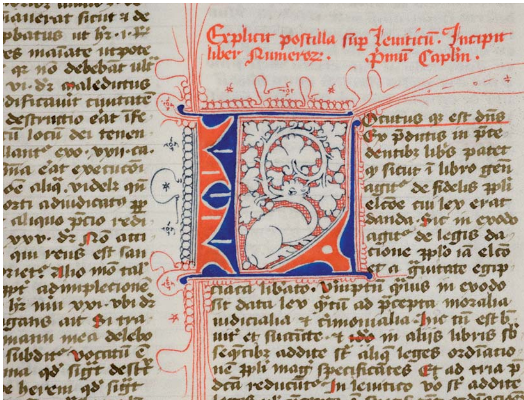
◀ 2 Draakje in de 'Bulten-en-lange-lijnen'-stijl (Utrecht UB, Hs. 249, fol. 110r).

maar de meeste stijlen worden in boeken aange- troffen uit meer dan één klooster of instelling.