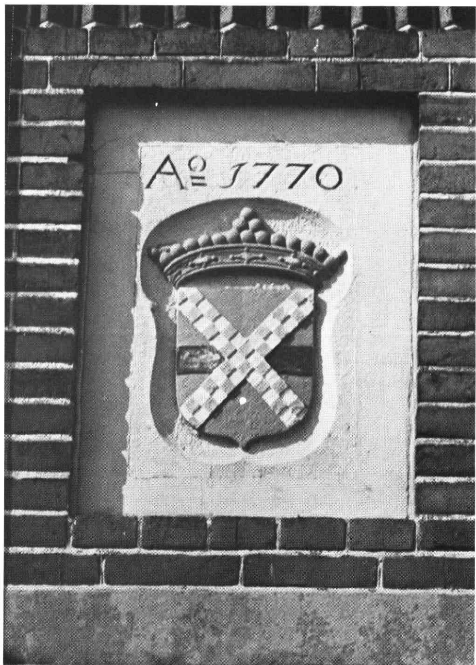
Afb. III. Gevelsteen bij Benschopperpoort.