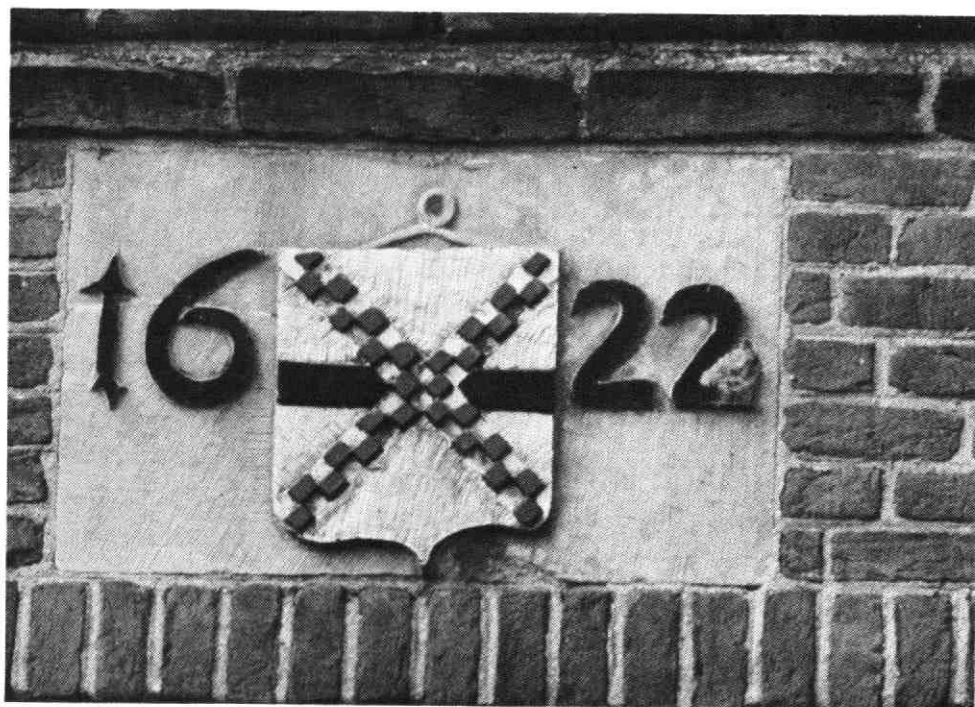
Afb. I. Gevelsteen op het Brandweershuisje.

IJsselpoort, dan treffen we het wéér aan (afb. I) op het oude Poorthuisje (Brandweershuisje). Het kleurig wapenschild wordt hier geflankeerd door het jaartal 16.....22.