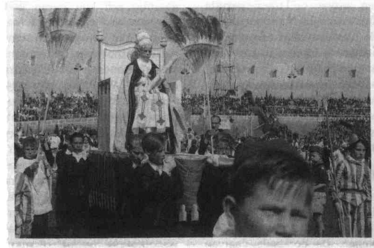
Miniatuur-paus wordt het stadion ingedragen. Er was duidelijk gezocht naar een zesdeklassertje dat een beetje op Pius XII leek.

ook een lichtvoetige, maar blijvende kennismaking met de geschiedenis van hun katholieke voorouders, met wie ze zich even konden identificeren. De eerste geloofsverkondigers Servatius, Lambertus, Willibrord en Bonifatius draafden op en de velen die later vanuit Nederland in hun voetspoor zijn gevolgd. Een voorname accent lag op de schoolstrijd in de 19e en het begin van de 20e eeuw, waarin de katholieke bevolkingsgroep (en de protestantse, maar die was niet te zien) de voor Europa unieke gelijkstelling van openbaar en bijzonder onderwijs had bevochten. De maquette van de geplande medische faculteit van Nijmegen, waarvoor de feestgave van een miljoen gulden bestemd