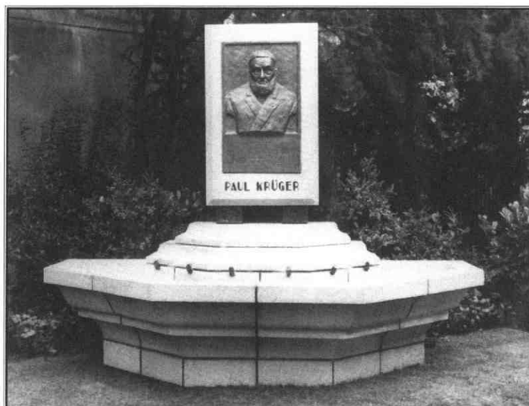
Het gedenkteken voor Paul Kruger, 1952.