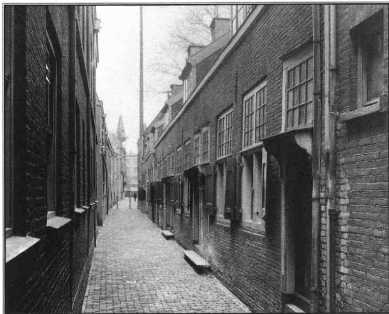
De Zakkendragerssteeg in 1933.

Straatnamen werden tot in de 19e eeuw doorgaans niet gegeven door het stadsbestuur; ze ontstonden vanzelf. Zo kon de naam van een beroep of ambacht aan een straat worden verbonden omdat beoefenaars er bijeenwoonden of op een andere wijze hun stempel op de straat drukten. Een bekend voorbeeld daarvan is de Zakkendragerssteeg. 1