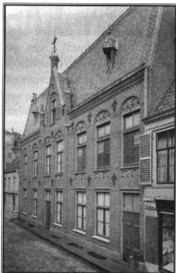
Het Sint Gregoriushuis, Herenstraat 6 in 1923. Het pand dateert van 1875

Gregoriusschool en de Sint Jozef-school (1880 - 1918) waren respectievelijk een 'burgerschool' en een 'volksschool'. Beide waren eigendom van de congregatie en gevestigd in of bij het klooster aan de Herenstraat. De Sint Augustinus-school (1887 - 1902) was gelegen aan de andere kant van Utrecht, aan de Kruisweg, en was eigendom van de parochie van Sint Au-