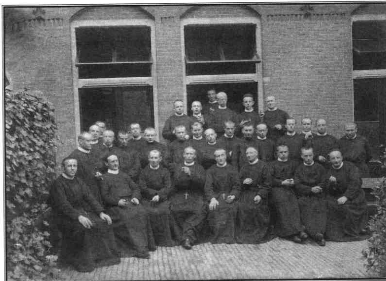
De fratergemeenschap in de tuin van het Sint Gregoriushuis, 1899

aan katholieke scholen in het aartsbisdom door de fraters was opgeleid aan de Sint Ludgerus-kweekschool in Hilversum. Bovendien maakten veel katholieke scholen gebruik van het lesmateriaal dat door de fraters werd ontwikkeld en dat werd uitgegeven