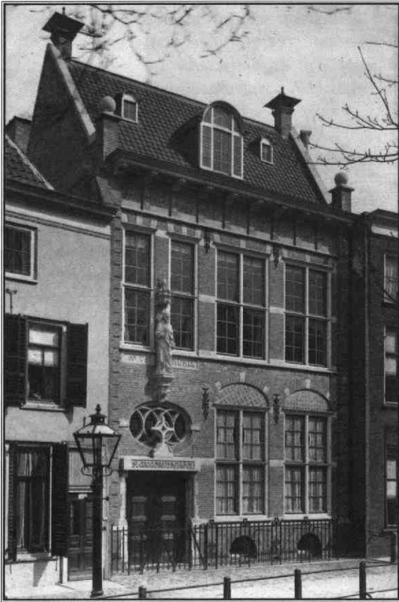
Het nieuwe pand van de Sint Gregoriuschool, Kromme Nieuwegracht 34 in 1909. Later kreeg de school een dependance aan het Hieronymusplantsoen

die een zogenaamde 'interparochiële' school was, de beste leerlingen uit de omliggende Utrechtse parochies aantrok. De pastoors, schoolbesturen en onderwijzers van die parochies trachtten op allerlei manieren een einde te maken aan deze concurrentie. 13 De fraters hebben echter altijd het been stijf gehouden waar het de belangen van de Sint Gregoriuschool betrof, zelfs toen hun dat in 1950 op een aartsbischoppelijke waarschuwing kwam te staan: 'U wordt als concurrenten beschouwd, en zelfs als machtige en gevaarlijke concurrenten! Wij willen U niet verhelen, dat de huidige situatie ons verontrust. Laat het zijn, dat de klachten, die Ons zo nu en dan bereiken, onrechtvaardig zijn, minstens in sommige gevallen is de schijn tegen U. En zelfs dat moet vermeden worden.' 14 Na 1960 verloren deze conflicten aan scherpte omdat de fraterscholen meer en meer 'gewone' katholieke scholen werden waarvan het onderwijzerskorps in meerderheid uit leken bestond.