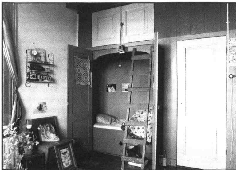
Trappenhuis, keuken en kamer met bedsteden

markt verhuisde eind jaren zestig naar het huidige terrein aan de Kardinaal de Jongweg om plaats te maken voor de Jaarbeurs . Karaktervolle bouwkundige en industriële elementen kenmerkten het gebied: de Hojelkazerne en Jaarbeursgebouwen aan de Graad van Roggeweg en Croeselaan, kleine bedrijfjes aan de Groenendaalstraat, de stadstimmerwerf aan de Jekerstraat, de veilinghal in de Bolksbeekstraat, het depot van grof afval aan de Van Zijstweg en de daarbij behorende gebouwtjes van scharrelaars. Hoewel het spoor niet meer in gebruik was, bleef de hefbrug tussen de twee havens lange tijd bestaan. Aan de kop van de Jekerstraat torenden de zuigers en kraan van het daar gevestigde zand- en grintbedrijf hoog boven alles uit.