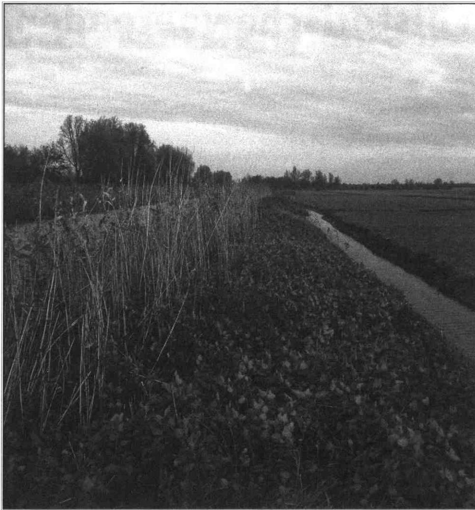
Kade langs Heicop

nieuw onder de aandacht brengen. Het plan Zichtbaar maken van historische voetpaden richt zich op drie gemeenten, particuliere grondeigenaren en recreanten. Bedoeling is een deel van de identiteit van het historische landschap te herstellen en waar mogelijk de historische wegstructuren nieuwe functies te geven. Bewoners, recreanten en toeristen kunnen dan weer, ver weg van snelweg en bebouwing, te voet het agrarische cultuurlandschap en de geschiedenis van een streek herontdekken. De paden zorgen daarnaast voor een betere toegankelijkheid van natuurgebieden en cultuurlandschappen. De omgeving komt in een geheel nieuw daglicht te staan. Als groene linten in het landschap zijn voetpaden ecologisch, recreatief én cultuurhistorisch interessant.