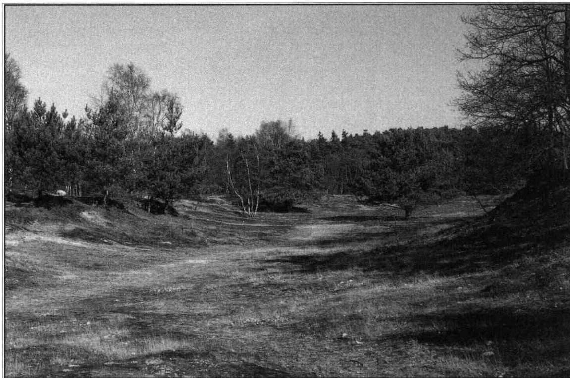
Heidelandschap met Koeheuvels