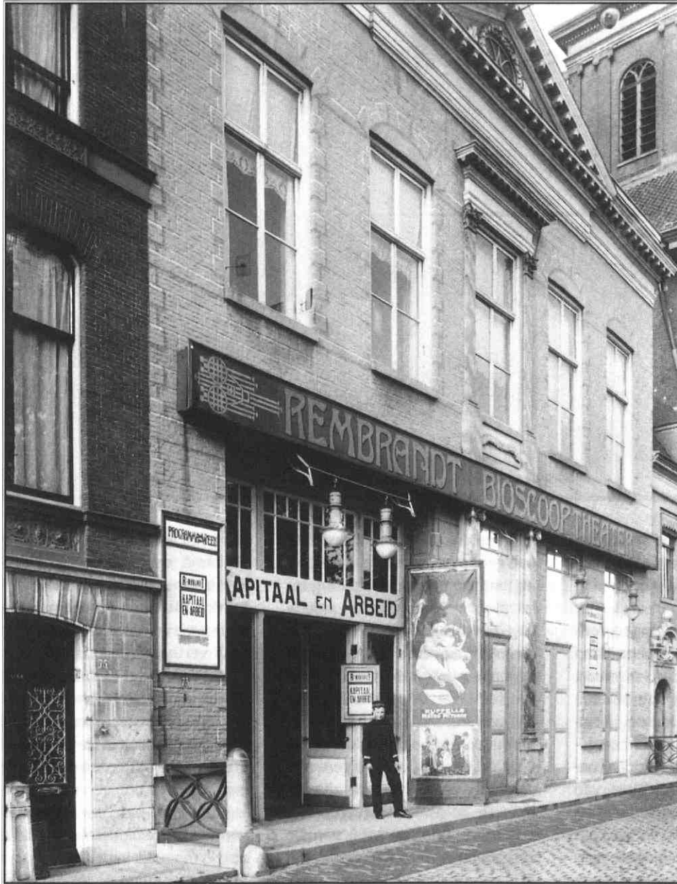
Rembrandt-bioscoop in 1918.

In december 2000 dreigden FC Utrecht supporters bioscoop en personeel van Camera-Studio aan de Utrechtse Oudegracht te 'komen verbouwen' als de documentaire 'Ajax, daar hoorden zij Engelen zingen' niet uit roulatie werd genomen. De voetbalfans waren niet de eersten die vertoning van een film probeerden te beletten. Katholieke studenten en arbeidersjongeren en militante feministen gingen hen voor.