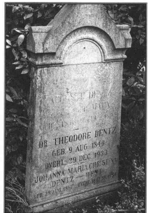
Grafsteen Theodore Dentz, huidige staat, begraafplaats Soestbergen, Utrecht

De grafstede van Theodore Dentz ligt vrij dicht achter het gietijzeren ingangshek aan de Gansstraat. Aan het tweede pad schuin naar rechts kan de eenvoudige staande