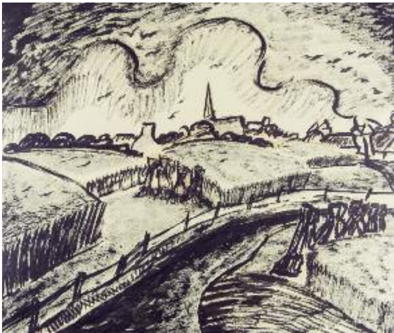
Boven links: Toon Tieland, Gezicht op Thielt (pen, 1953).