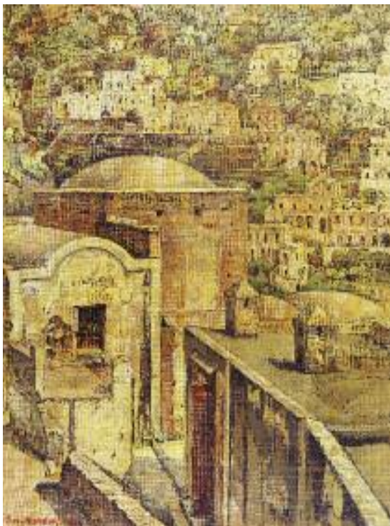
Links: Sara van Heukelom, Gezicht op Positano (olieverf, 1924).