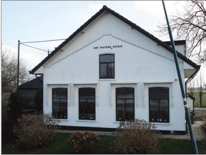
Het Papiere(-n) Huisje.