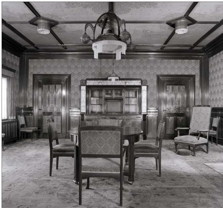
Interieur van de eetkamer van 't Uiltje.

hij geëerd met een bank, die geplaatst werd op de kruising van de Straatweg en de Bloklaan. De onthulling ervan zou hij niet meemaken, hij overleed twee maanden voor zijn jubileum. De bank zou later verplaatst worden naar de bocht van het jaagpad naar het Cronenburgerlaan. 5)