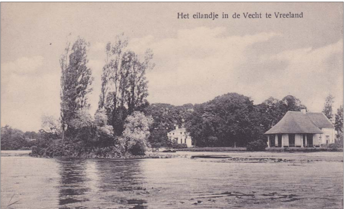
Het eilandje in de Vecht te Vreeland

Het eilandje Blijdenstein in de Vecht, gelegen voor het koetshuis van Slotzicht. Foto circa 1910.