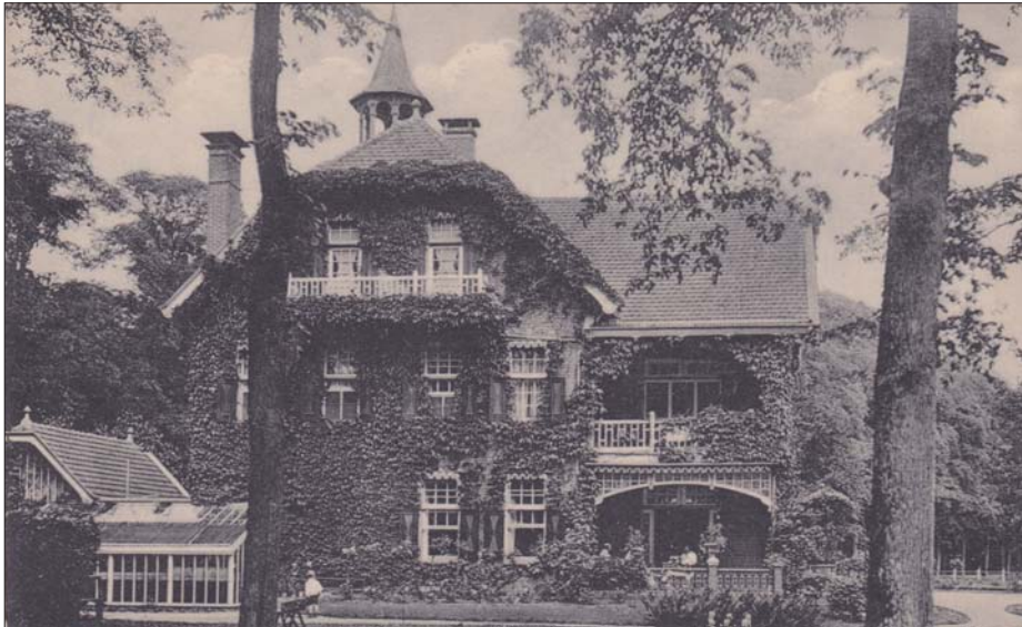
Villa 't Uiltje gezien vanaf de Vecht. Foto uit 1922.