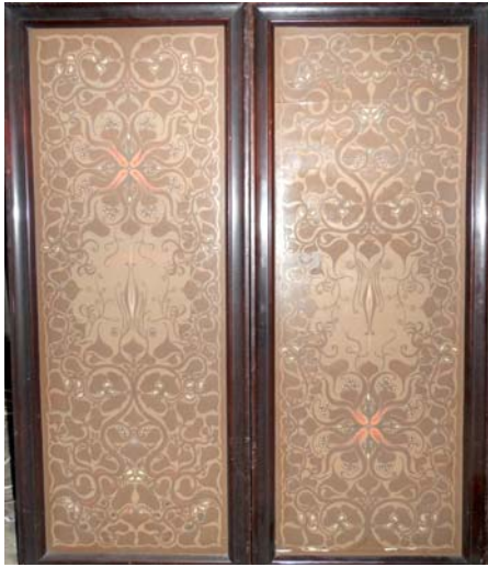
Plafondpaneel uit een van de kamers van 't Uiltje, ontwerp van Theo Nieuwenhuis, 1916.

huis door de Duitse marine gevorderd werd. Zij zou er na de oorlog niet terugkeren en haar laatste levensjaren tot haar dood in 1948 bij haar dochter op 't Uiltje doorbrengen. Middenhoek werd na de oorlog verdeeld in verschillende woon-eenheden. Het huis zou in 1956 jammerlijk afbranden.